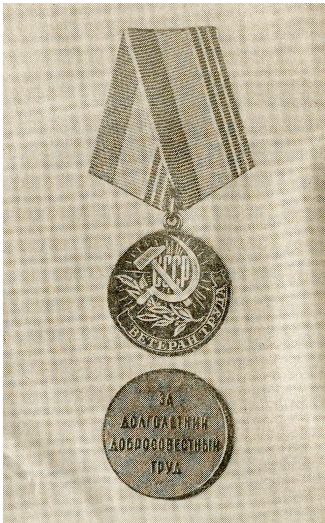
Медаль «Ветеран труда»