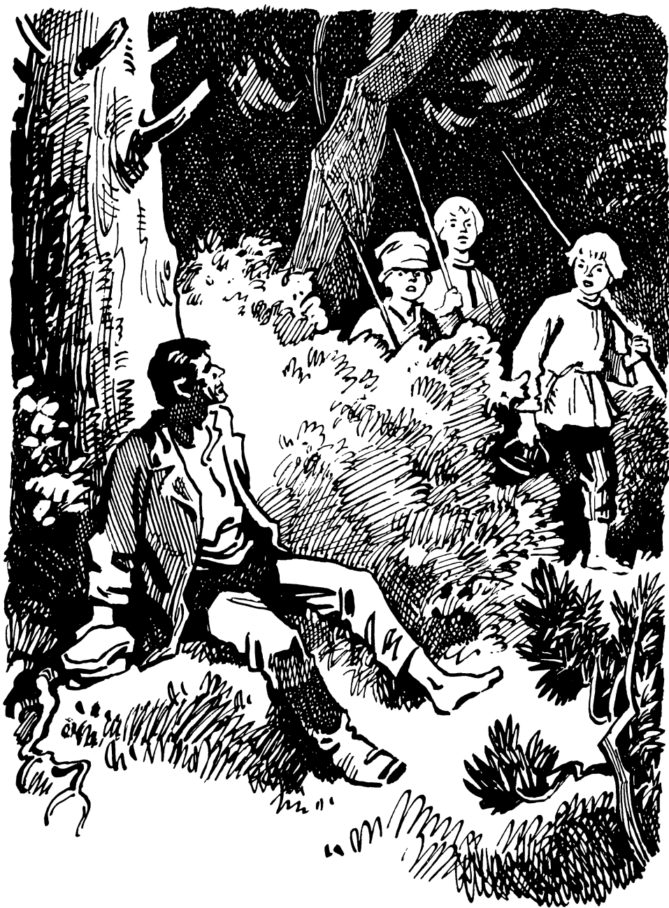
Прислонившись к сосне, сидел человек.