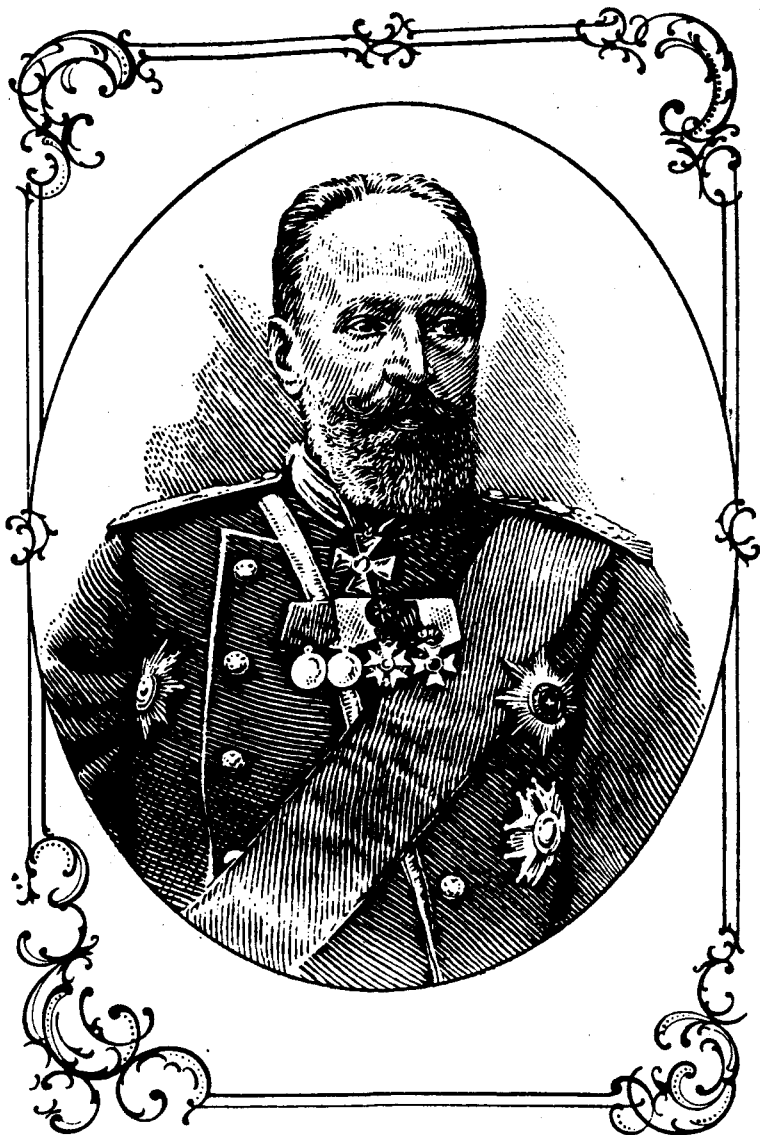
СЕРГЕЙ ЮЛЬЕВИЧ ВИТТЕ 1849–1915