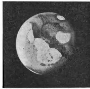
Наблюденія Е. М. Антоніади (Медонъ). Фиг. 2.

смотреть на Марсъ въ трубу черезъ красное стекло, то материкъ почти не мѣняютъ своей яркости, тогда какъ моря сильно ослабѣваютъ, дѣлаются весьма темными и потому становятся видимыми гораздо лучше.