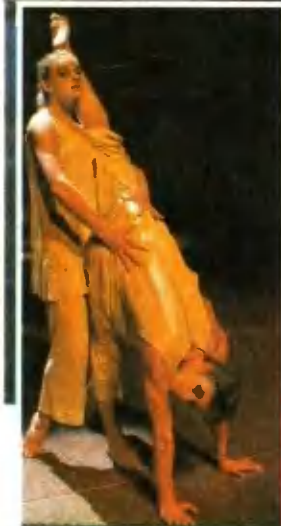
Сцены из балетов «Игра в прятки с одиночеством» и «Пиковая дама»

На cassette вы услышите песни из альбома «Мечта самоубийцы». Музыка, слова и аранжировки М. Борзыкина.