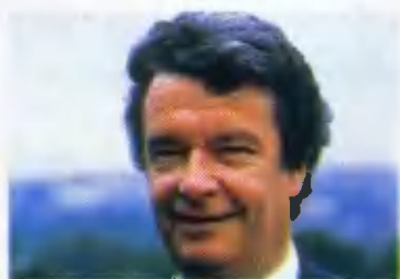
ТЬЕРРИ ДЕ БОССЭ

Театр Марины, в главной роли — Сирано — Жан-Поль Бельмондо. Постановщик — Робер Оссейн. Удар Оссейн нанес сразу. Он ввел лейтмотив из Грига. Он взял «Смерть Озе» и перенес ее во Францию XVII века. Я показываю этот момент на пластинке. В театре удалось услышать подлинный голос Бельмондо (в кино он часто занят переводом или искажением) — чудесный глубокий бас. Режиссер предложил ему сыграть Сирано несколько лет назад. Жан-Поль попросил «чего-нибудь полегче». Оссейн дал ему пьесу Сартра «Кин». Тот согласился, не подозревая, что «Кин» труднее «Сирано». После такой «тренировки» Бельмондо справился с Сирано блестяще. Сейчас спектакль «поехал» по миру. И Оссейн, и Бельмондо мечтают показать пьесу у нас. И тут подоспела пора сказать о том интервью с министром де Боссэ, которое наконец, «под занавес» лоздки, состоялось. И так,