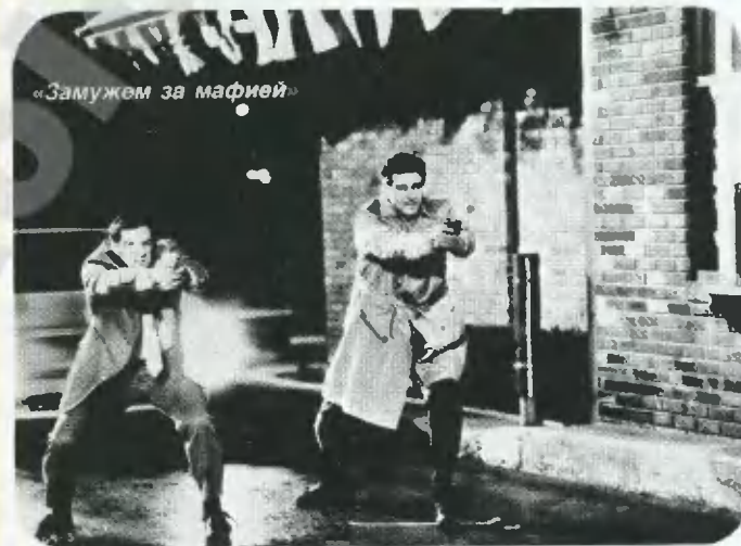
«Замужем за мафией»