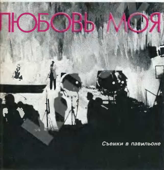
Съемки в павильоне

И стараться не стоит. Авторы, видимо, понимали это и потому в финале долго и подробно объясняют, как было дело и кто истинный преступник.