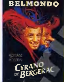
«СИРАНО ДЕ БЕРЖЕРАК»