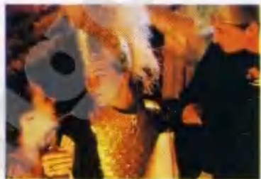
«МОНЕТЫ И МЕДАЛИ»

В бюро «Олимпии» мне порекомендовали посмотреть и послушать молодежную оперу, показывающую спектакли во дворце-музее, который в Париже сокращенно зовется