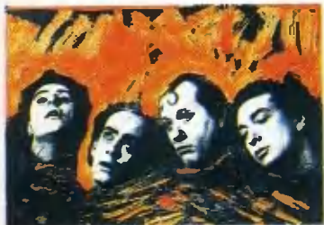
ЗАБРОСИТЬ МИКРОФОН В БУРЛЯЩЕЕ МОРЕ ТЕАТРАЛЬНОГО ПАРИЖА