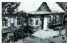
Дом, где проходил съезд РСДРП.