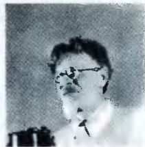
М. И. Калинин

Кремлевский Дворец съездов. Работает XXIV съезд КПСС.