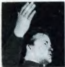
С. М. Киров