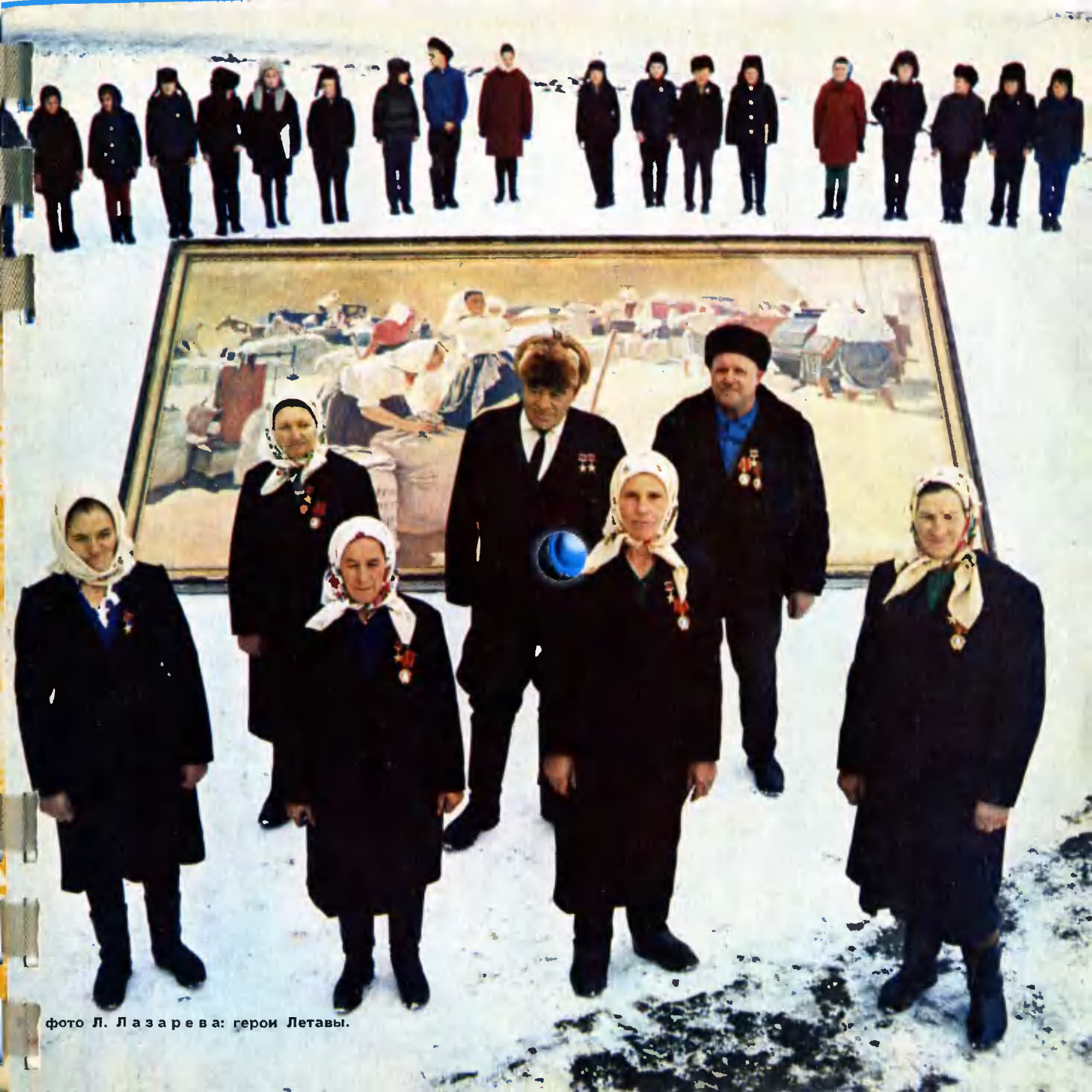
героини Летавы.