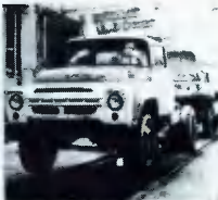
Сборка первых АМО. ЗИЛ сегодня.