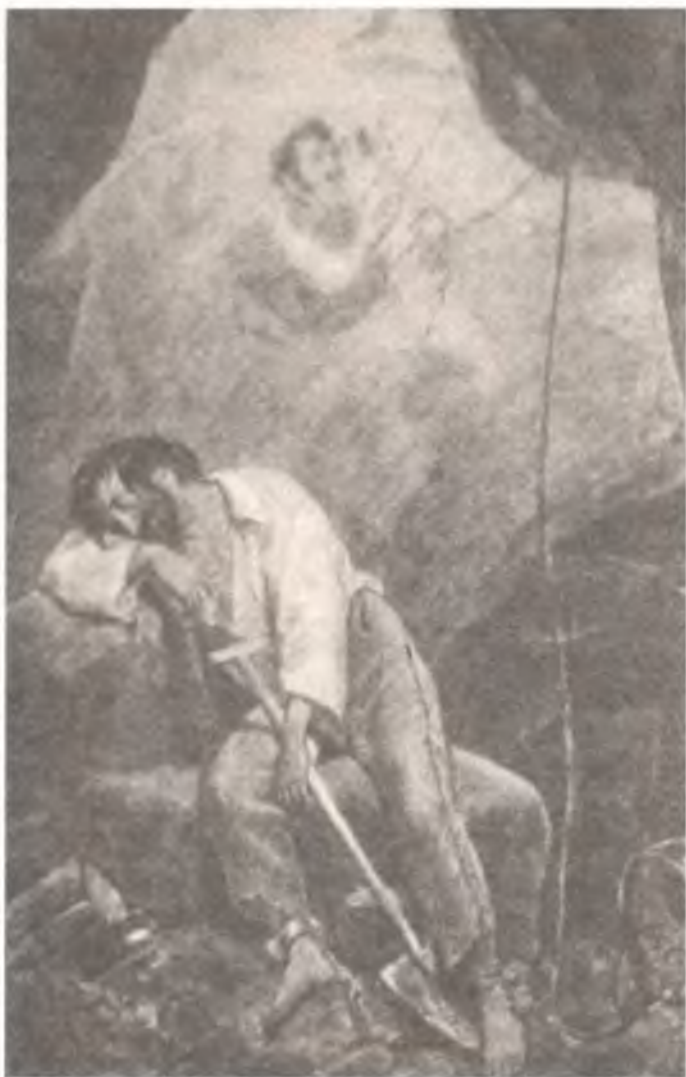
Сон декабриста С. Г. Волконского. Рисунок К. П. Брюллова