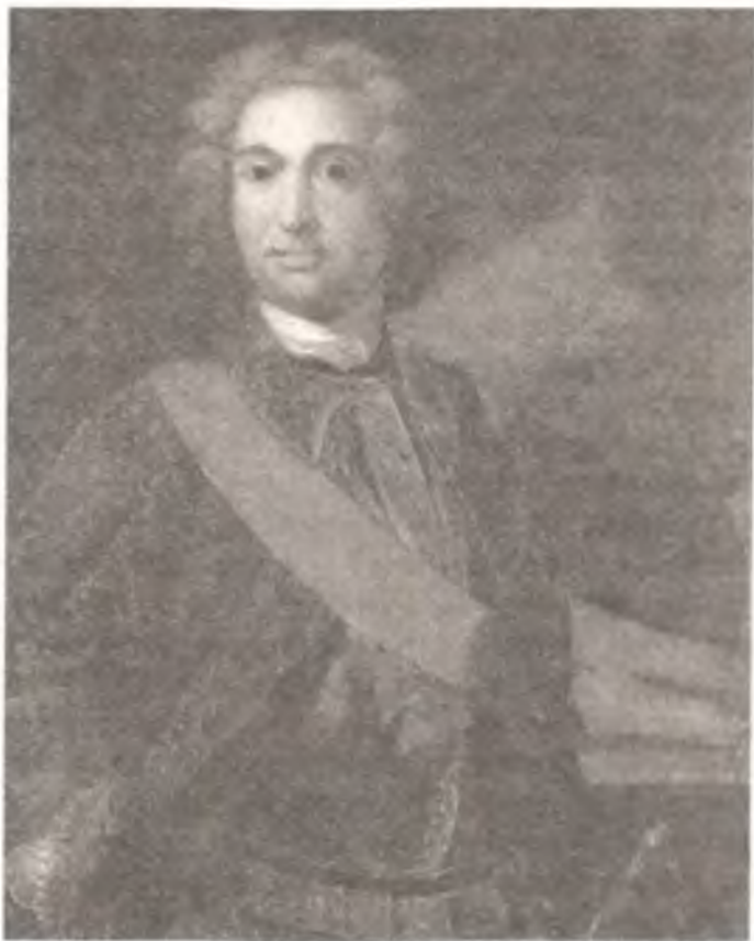
Бурхард-Христофор фон Миних

Миних до последней минуты был верен Петру III. И если тот следовал бы его советам, еще неизвестно, в какую сторону круто поворотилось бы дышло истории российской (о сем — погодя).