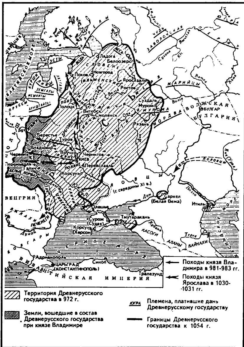
Русь в X-XI вв.