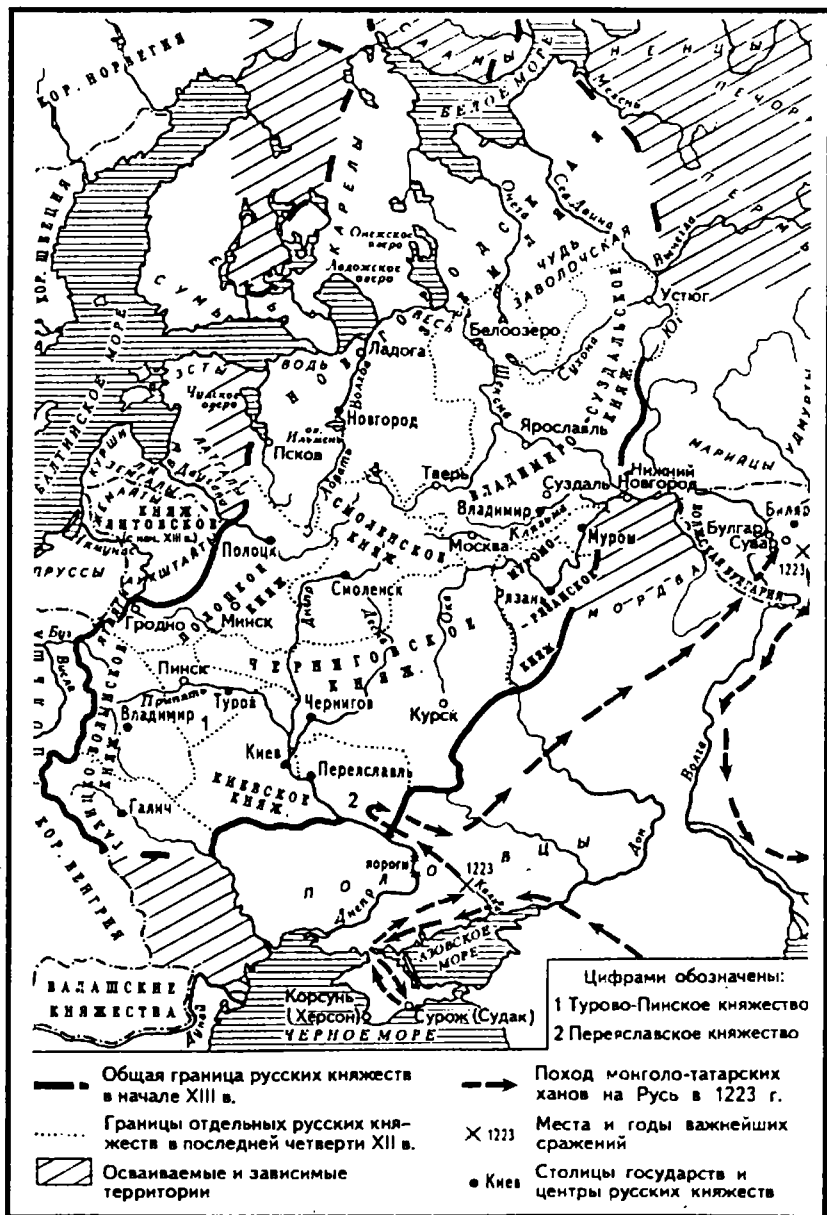
Русь в XII-XIII вв.