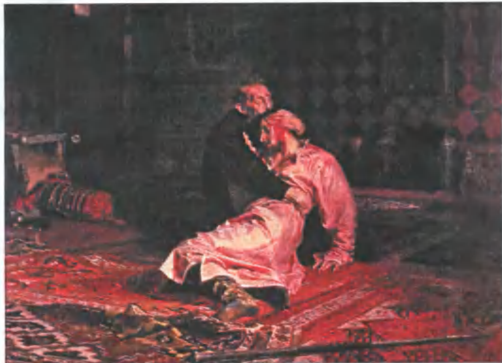
И. Е. Репин. Иван Грозный и сын его Иван. 1885