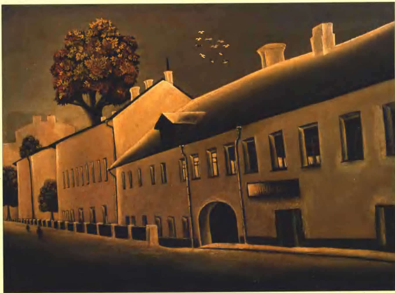
Кадашевская набережная. 1970