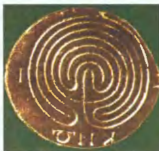
Лабиринт на кносской монете. I тысячелетие до н.э.