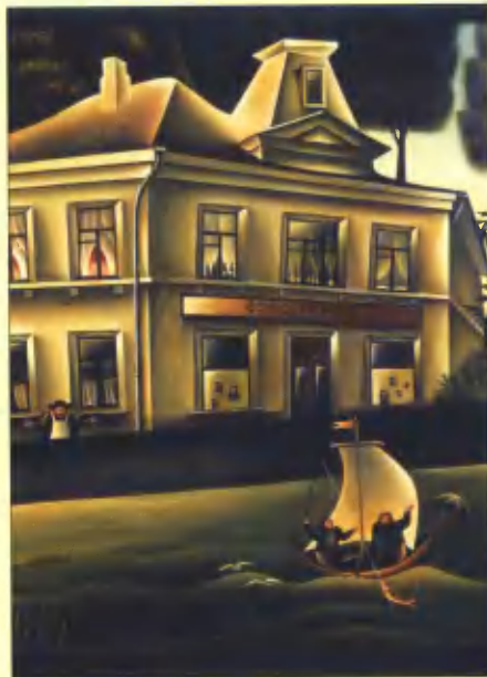
Романтический пейзаж с рыбаками. 1975