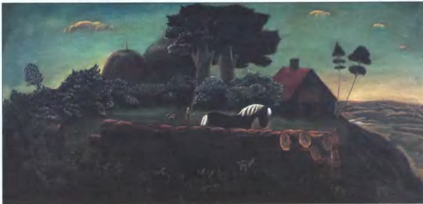
Идиллический пейзаж с лошадью. 1970

С противоположной стены, как неведомых пришельцев, изучают нас мудрые глаза преподобного Серафима Саровского и