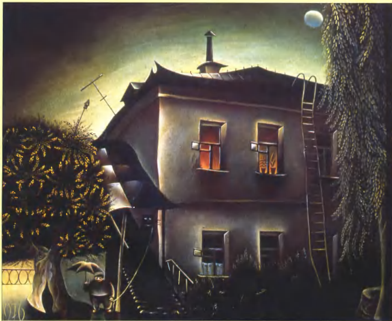
Выгуливание кота в лунную ночь. 1976