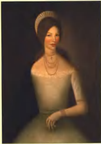
Портрет девушки в коношнике. 1986