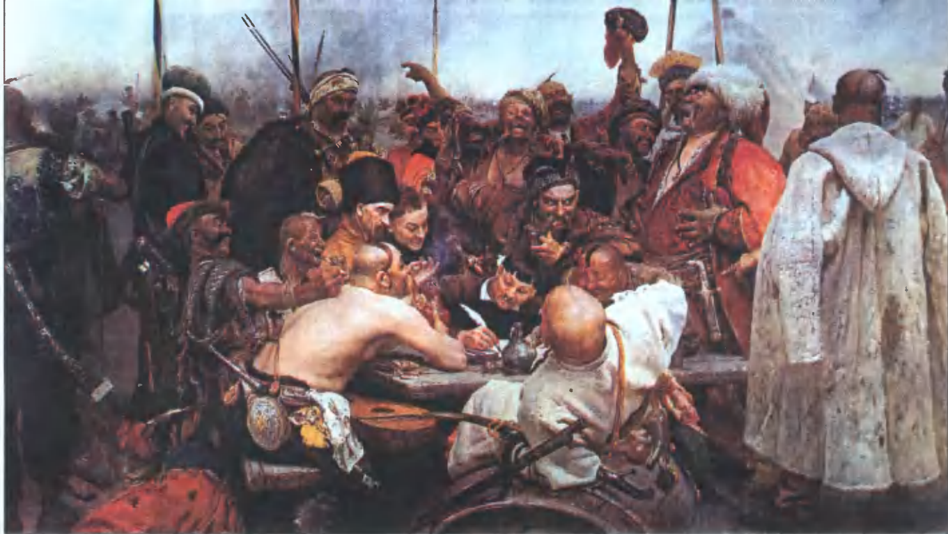
И.Е. Репин. Запорожцы пишут письмо турецкому султану. 1891