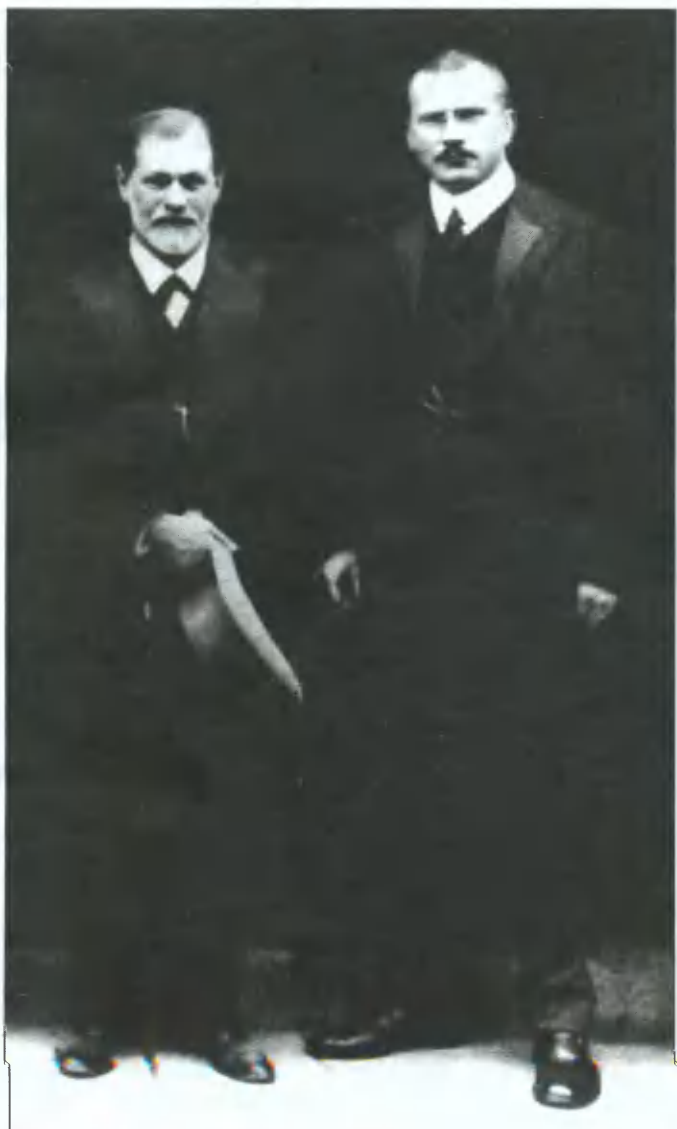
Зигмунд Фрейд и Карл Юнг. 1909

Француз Бернар Ашеро попал в Книгу рекордов Гиннеса благодаря своему отношению к роковым совпадениям. Судьба его явно преследует, однако, несмотря на это, он остаётся весельчаком и балагуром.