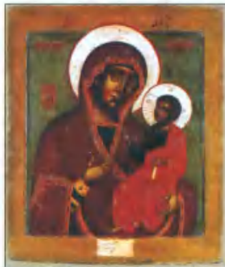
Богоматерь Иверская. Центральная Россия. Конец XVII — первая треть XVIII века

Мама, хотя и была католичкой по рождению, тяготела к православию. Особенно почитала она икону Иверской Богоматери. Она часто ездила в Иверскую часовню и брала нас, детей, с собой помолиться. Эта часовня была удивительная. Крошечная, совсем простенькая, даже невзрачная, с ярко-синей крышей и крестом на ней. Сюда и днём и ночью стекался народ со всех концов Москвы и России. Кого там только не было: и странники в лаптях, с котомками на спине, и крестьяне, и нищие, и дамы, и простые женщины, военные и штатские, богатые и бедные, — все шли сюда. На сколько горя, мольбы и надежды было в их глазах, устремлённых на тёмный лик иконы! Мне тогда казалось, что икона, мерцающая в полумраке и освещённая сотнями восковых свечей, сама смотрела с умилением и жалостью на