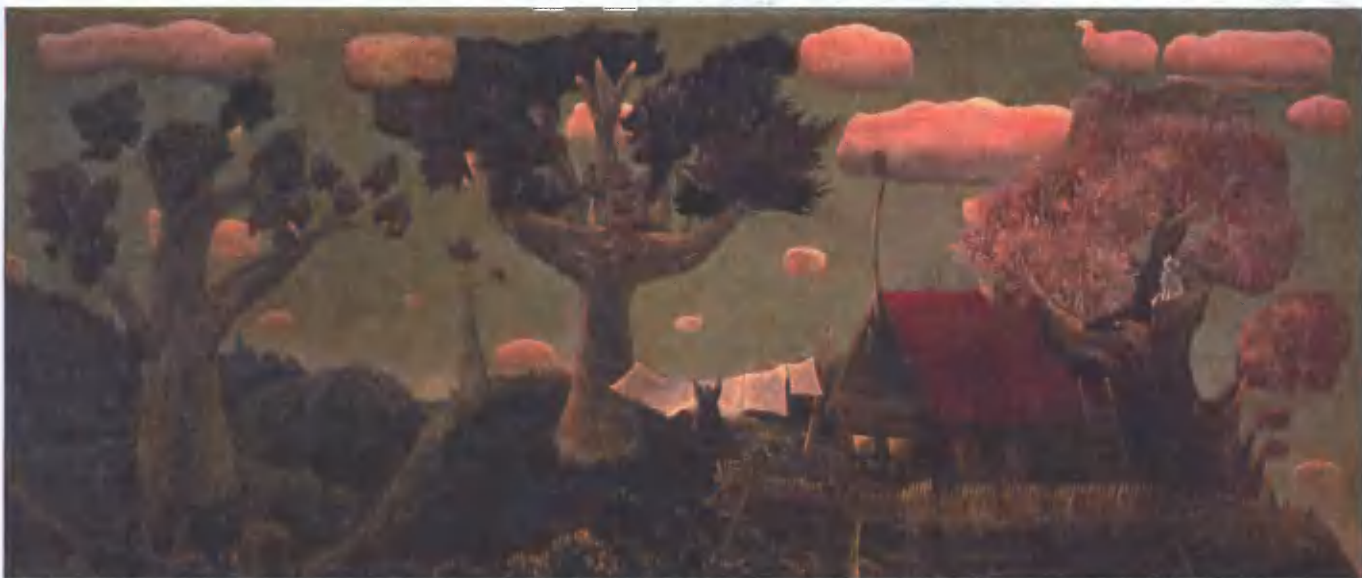
На краю света. 1970