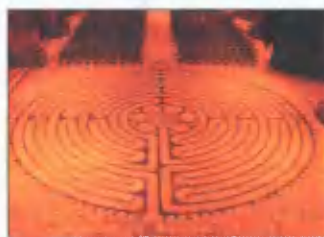
Лабиринт Шартрского собора. XII век