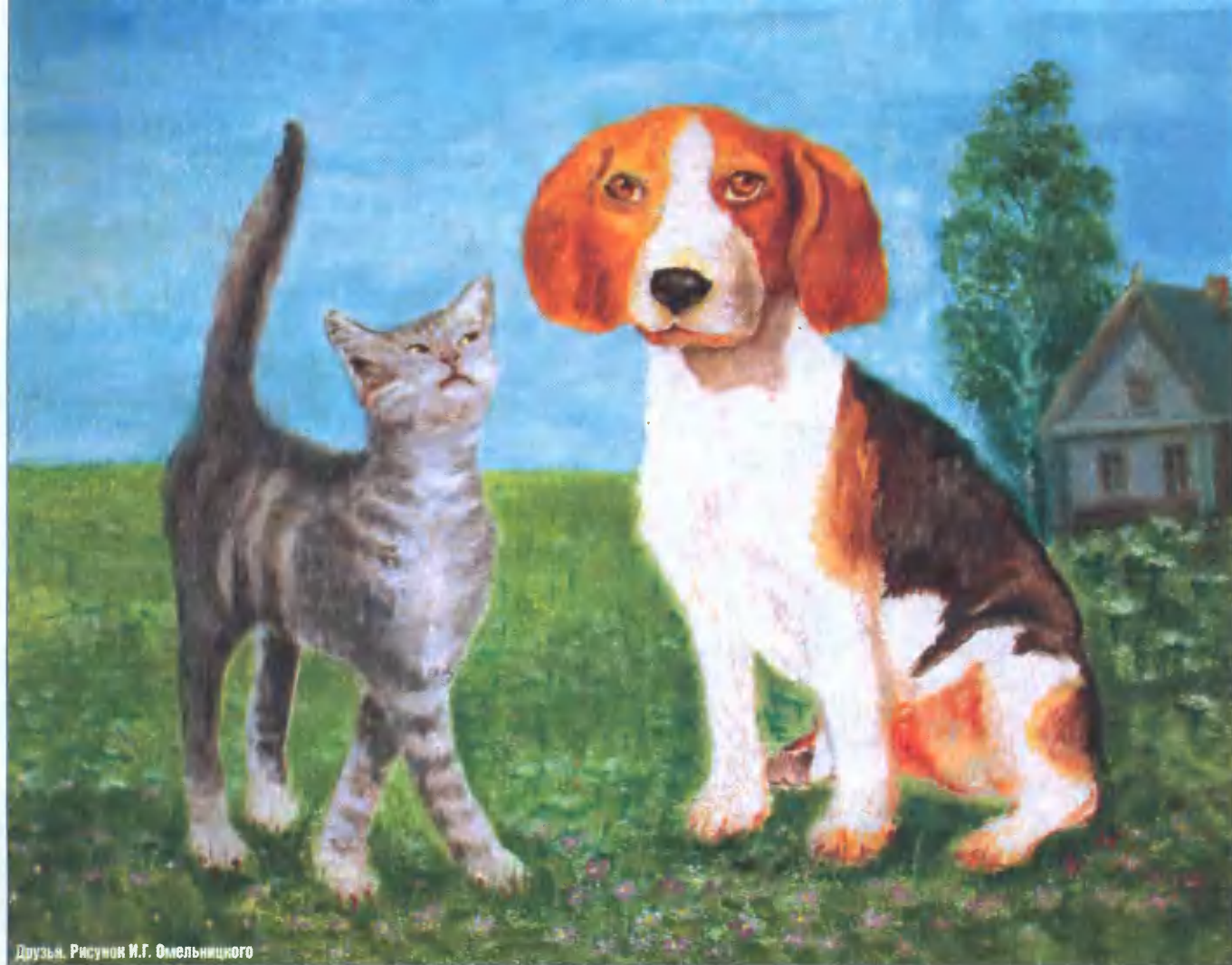
Друзья. Рисунок И.Г. Омельниченко