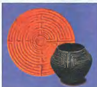
Италия. Лабиринт на стене собора XIII века