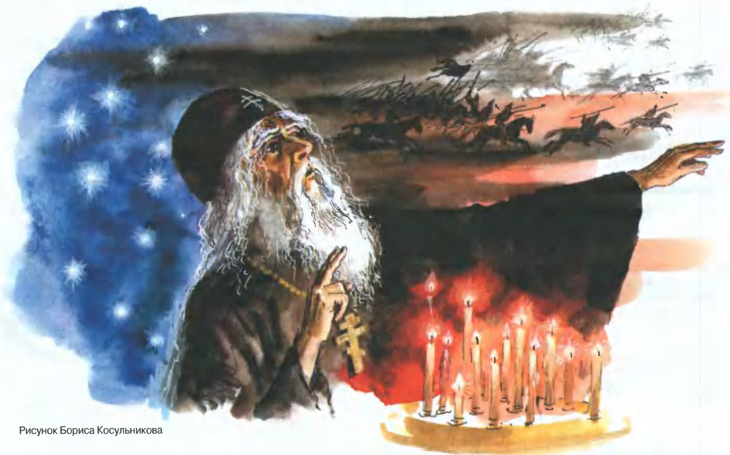
Рисунок Бориса Косульникова

блюдал Куликовскую битву. А как же быть с предсказаниями монаха Авеля? Ведь он говорил о событиях ещё не произошедших и даже отдалённых более чем на сто лет. Но и в этом случае нет никакого противоречия.