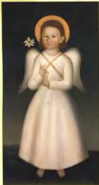
Ангел младенец. 1999