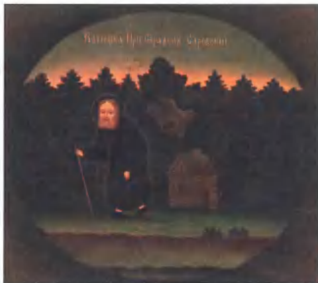
Преподобный Серафим Саровский. 1991