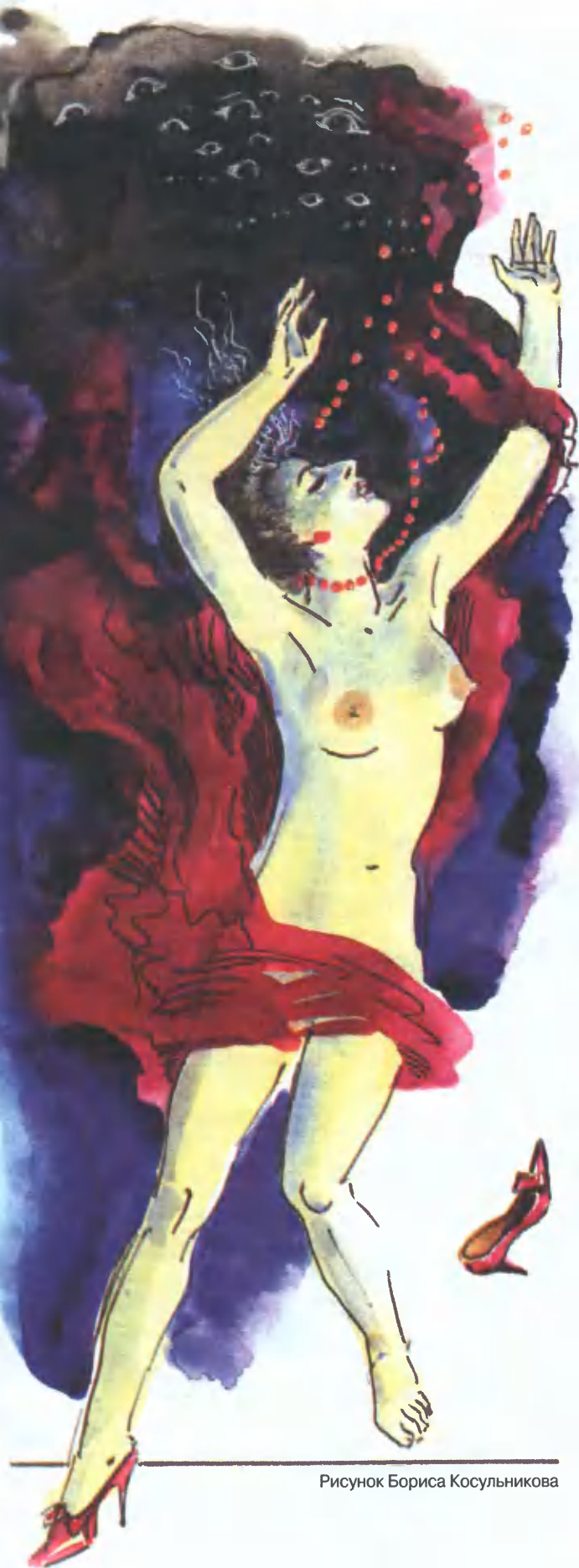
Рисунок Бориса Косульникова

На том свете души могут испытывать скуку и, чтобы прогнать её, стараются найти развлечение в реальном мире.