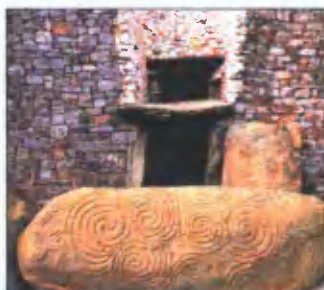
Англия. Камень веры из Ньюгрейджа

Таким образом, древние знания рассматривали путь человека к совершенствованию как развёртывание мировой космической спирали, которая в определённых условиях могла приобрести облик загадочного каменного лабиринта.