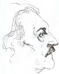
ЖУРНАЛ ОСНОВАЛ ВАСИЛИЙ ЗАХАРЧЕНКО В 1991 ГОДУ