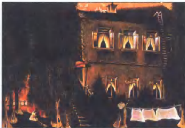
Московский дворик. 1971