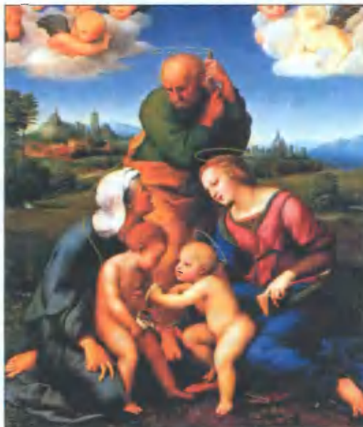
Рафаэль. Мадонна Кандиджи. 1508

На допросе в Нюрнбергской тюрьме Франк показал, что имущество, награбленное подчинёнными, начали вывозить из Кракова в конце лета 1944 года в его баварское имение.