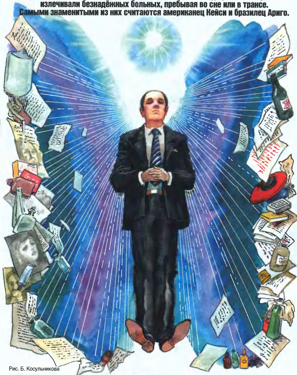
Рис. Б. Косильникова

История знает несколько случаев, когда целители без медицинского образования излечивали безнадежных больных, пребывая во сне или в трансе. Самыми знаменитыми из них считаются американец Кейси и бразилец Ариго.