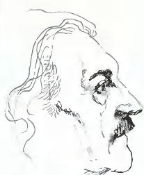
ЖУРНАЛ ОСНОВАЛ ВАСИЛИЙ ЗАХАРЧЕНКО В 1991 ГОДУ