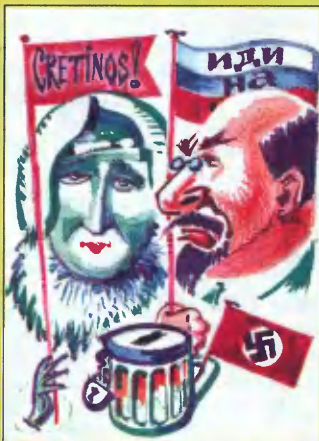
Рис. В. Плужникова