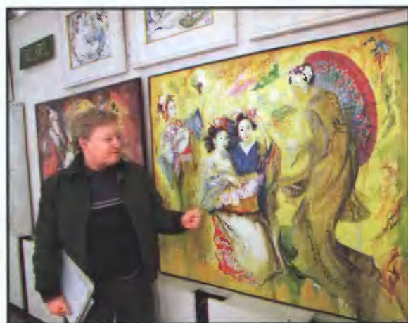
ВЛАДИМИР ИВАНОВИЧ ЩЕРБАКОВ (1938—2004)

Судя по всему, загадки Чудского озера ещё долго будут волновать исследователей разных специальностей — от археологов и гидрологов до историков и аномальщиков. Но, как это ни печально, вряд ли в ближайшие годы на озеро будет организована широкомасштабная экспедиция, подобная экспедиции генерала Караева. Разве что событиями 5 апреля 1242 года вновь заинтересуются профессора «плаща и кинжала».