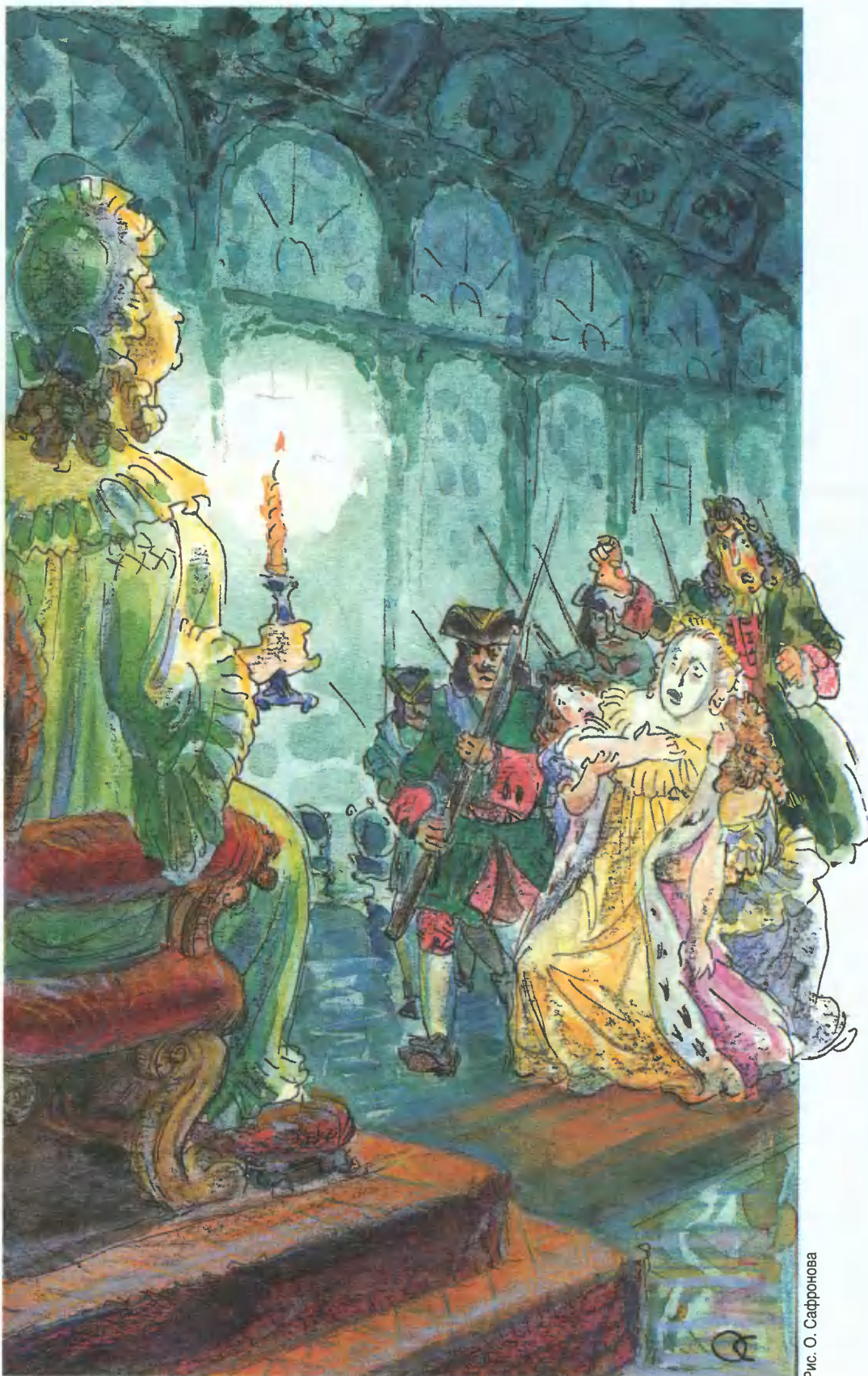
Рис. О. Сафронова

Встречи с допдельгенгерами были и в жизни российских императриц, которые трагически закончились для самих венценосных особ.