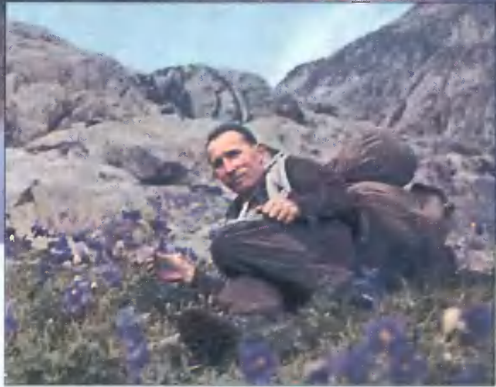
Автор на Мульти- нском озере.

открылись для автора только однажды. Вспоминая о них, он не понимает, что же это было в действительности