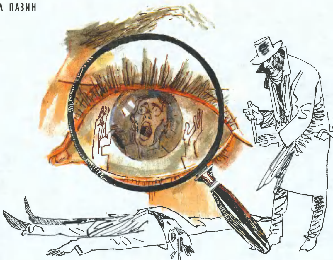
Рис. М. Петрова