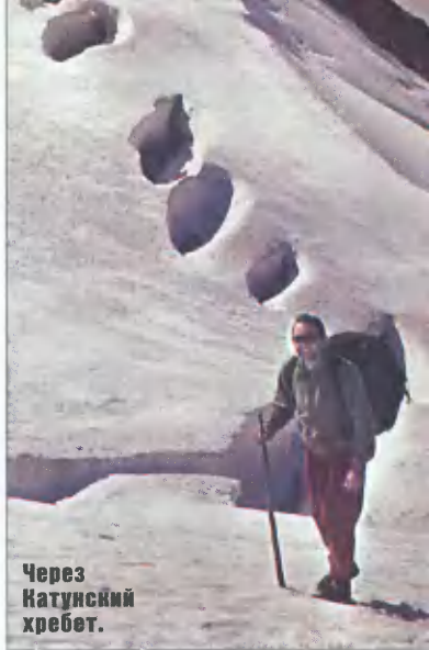
Через Катунский хребет.

Привал мы устроили уже с иным настроением. Бутерброд с вкусной сальмой, целительный чай и густое варенье волшебного кизила, способного утолять самую дикую жажду, зарядили нас на дальнейший спуск. С увесистыми рюкзаками мы скользили по леднику, как на лыжах, опасаясь набрать излишнюю скорость и не суметь вовремя затормозить. Ноги,