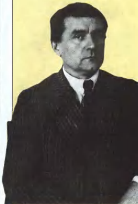
Казимир Малевич в 1927 году.

В среде современных искусствоведов и ценителей искусства имя художника-авангардиста начала XX века Казимира Малевича считается знаковым. Вокруг его самого знаменитого полотна — «Чёрный квадрат» — до сих пор не утихают споры. Что только не видится, не мнится изощрённым искусствоведам в квадратной беспроглядной черноте. Одни говорят, что чёрный