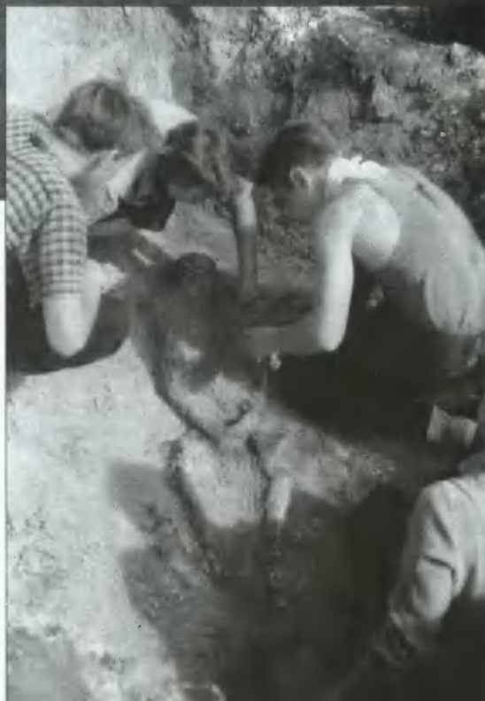
Раскопки на мысе Пнево. 1963 год.

Заявление малоизвестного немецкого историка стало причиной грандиозных исследований в районе Чудского озера, курируемых советскими спецслужбами