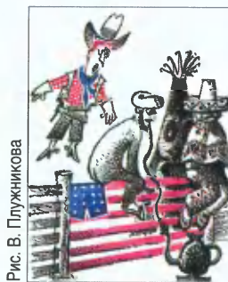
Рис. В. Плужникова