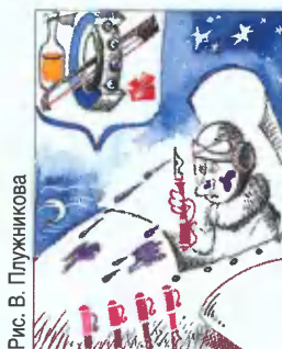
Рис. В. Плужникова