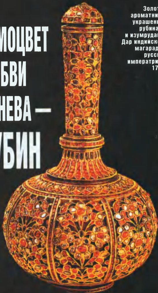
Золотая ароматница, украшенная рубинами и изумрудами. Дар индийского магараджи русской императрице. 1739.