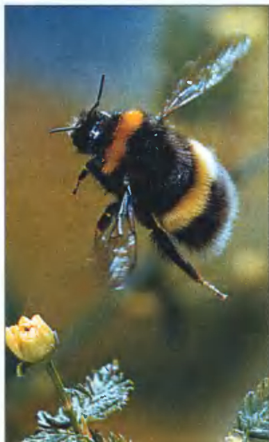
Шмель демонстрирует подъёмную силу своих крыльев.

В конце XIX — начале XX века Н. Е. Жуковский тщательно изучал механизм полёта птиц. Со временем благодаря этому он заложил основы современной аэродинамики, что привело к появлению авиации. Человека, столь же досконально изучившего природу летания насекомых, пока нет. Одно можно сказать точно: когда он появится, то станет родоначальником летательных аппаратов, столь же не похожих на современные нам крылатые машины, как они не похожи на аэростат братьев Монгольфье. ■