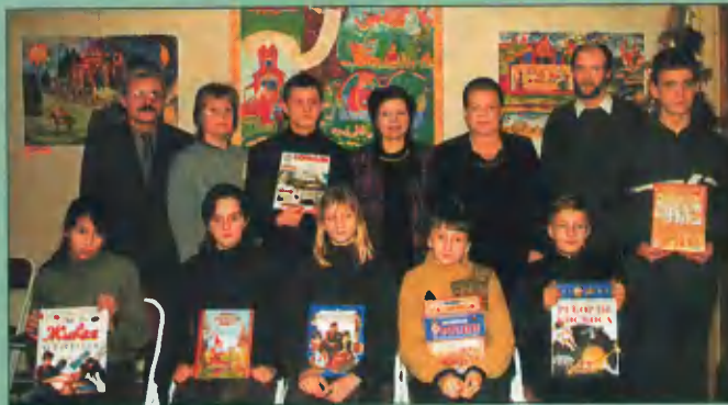
Юные художники и их наставники.

В залах светло. Солнечно. Радостно оживлены дети-авторы и их родители, гости. Первое впечатление: вы попали в непривычное для вас пространство ярких, светлых, радостных образов. И когда осознаёшь, что создатели этих удивительных картин — глухие дети, поневоле приходишь к оптимистическому убеждению: талант неистребим. Глухота усиливает, а может быть, даже открывает новые возможности зрения, позволяя человеку увидеть ускользающие от обычных людей грани окружающего мира и выплеснуть свои впечатления