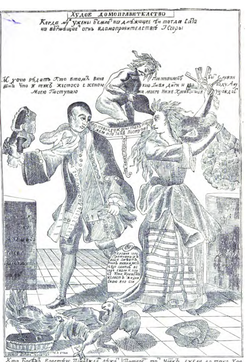
Кто Борбав Воостбле Линбжай лежа Латерет то Члекъ Ежели 20 тако Хоатому часто травы Помотоко лекарство илн Порча оно Пон последне Глануании Находится Ежели сму тарая Несчабликая кенитБа Случится