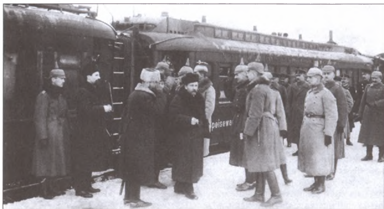
Приезд советской делегации на мирные переговоры в Брест-Литовск. Встреча на вокзале. Декабрь 1917 г.