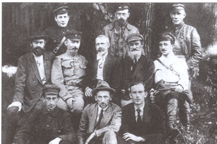
Мертворождённое коммунистическое правительство Польши — Польревком. В среднем ряду второй слева — Феликс Дзержинский. Белосток, август 1920 г.