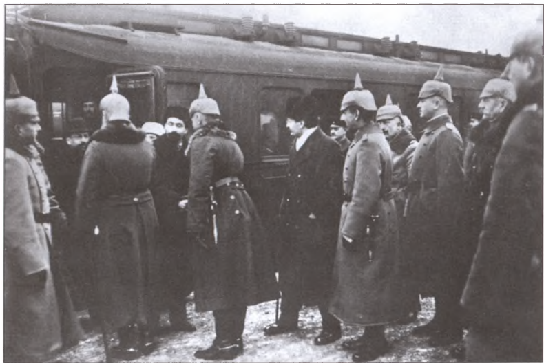
Отъезд русской делегации. В центре — Троцкий (стоит в профиль), слева Каменев и Иоффе