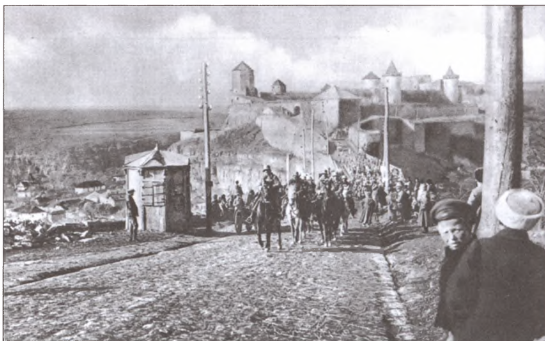
Австрийские войска занимают Каменец-Подольский. Март 1918 г.