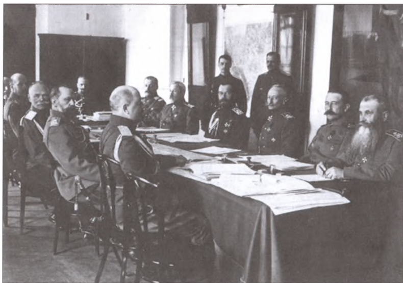
Русская Ставка ВГК. Третий слева — М.В. Алексеев. Справа от Николая II — А.А. Брусилов. Крайний справа — Н.И. Иванов. Апрель 1916 г.