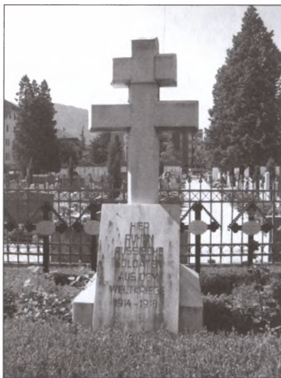
Памятник на братской могиле русских военнопленных. Воинское кладбище в Больцано (австрийский Боцен; Италия).