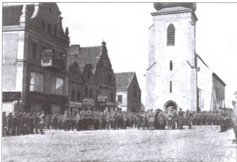
Русская армия во взятом ею Инстербурге, Восточная Пруссия (ныне — Черняховск Калининградской обл., РФ). Август 1914 г.