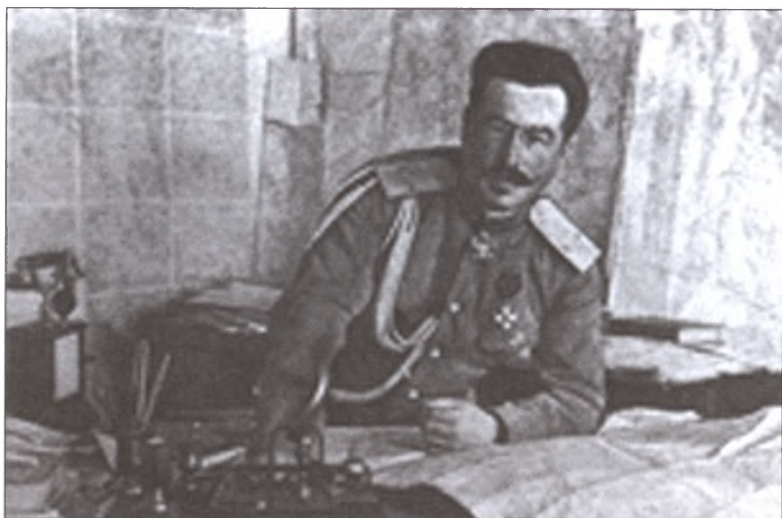
Последний исполняющий обязанности Верховного главнокомандующего Русской армией генерал Н.Н. Духонин. Убит восставшими солдатами