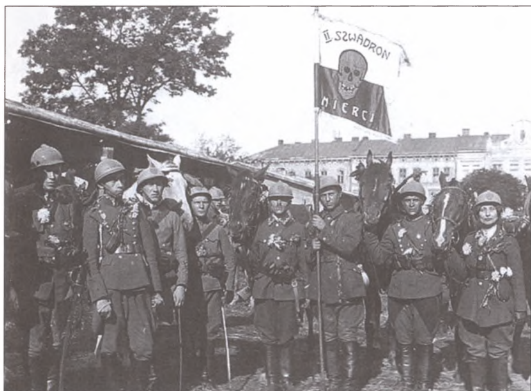
Смешанный (женско-мужской) польский «эскадрон смерти». Львов, 1920 г.