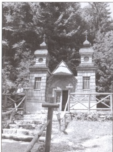
Часовня-памятник погибшим русским военнопленным. Юлийские Альпы, Словения.