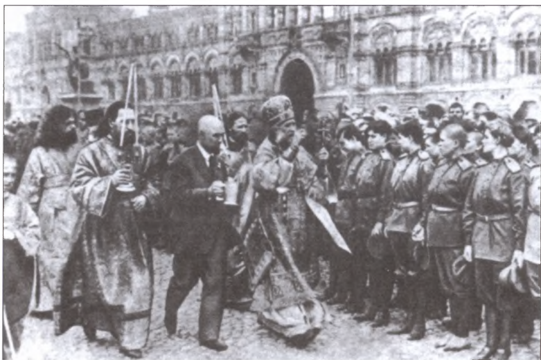
Московский митрополит (будущий всероссийский патриарх) Тихон благословляет Женский ударный батальон смерти