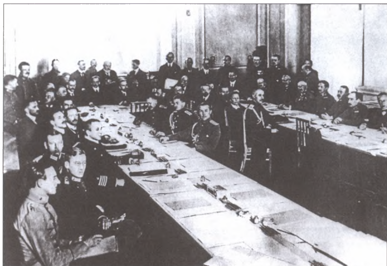
За столом мирных переговоров. Брест-Литовск. Январь 1918 г.