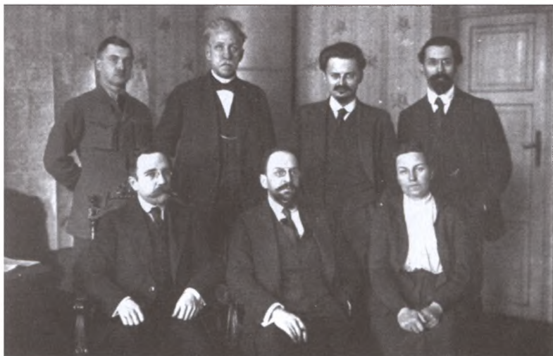
Советская делегация в Брест-Литовске. Слева направо сидят Л.Б. Каменев, А.А. Иоффе, А.А. Биценко, стоят В.В. Липский, П.И. Стучка, Л.Д. Троцкий, Л.М. Карахан. Январь 1918 г.