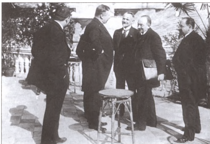
Германская (слева) и российская делегации в Рапалло (Италия). Апрель 1922 г. В Рапалло немцы и русские большевики неожиданно для западных держав подписали договор, заложивший основы тесного сотрудничества двух крупнейших европейских держав, в 1933 году прерванного приходом Гитлера к власти в Германии