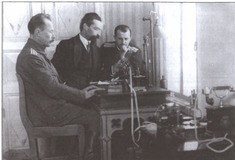
Русский телеграфный аппарат Брест-Санкт-Петербург