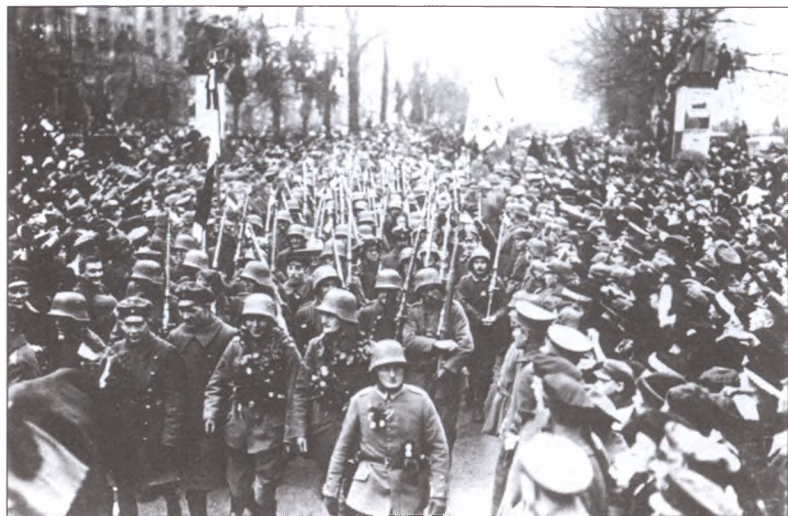
Они не победили, но дома их ждали всегда. Встреча возвращающихся фронтовиков. Берлин, декабрь 1918 г.