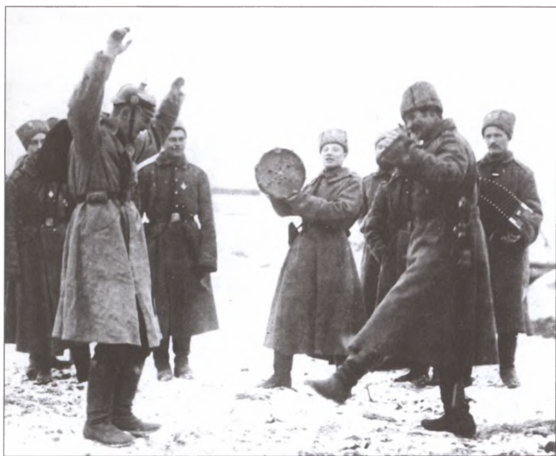
Братание русских и немецких солдат на фронте. Зима 1917—1918 гг.