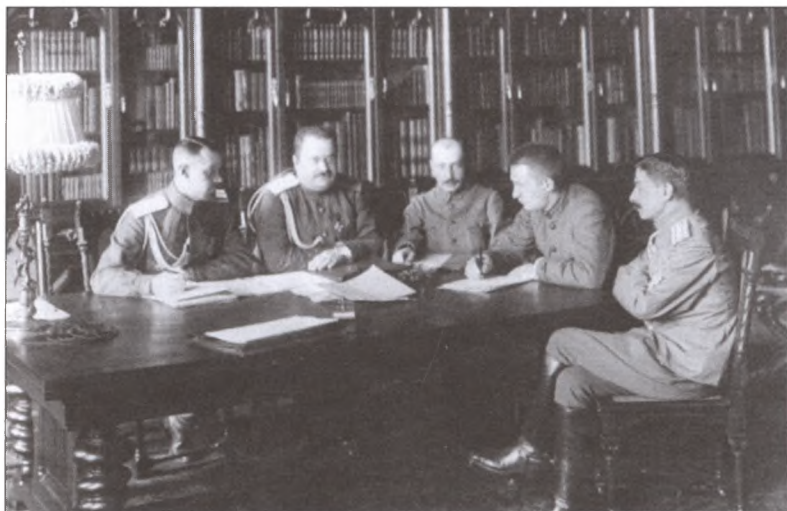
А. Ф. Керенский — второй справа — среди чинов военного министерства. В центре — Б.В. Савинков. Август 1917 г.