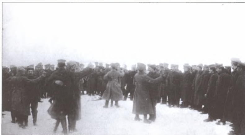
Братание русских и немецких солдат на фронте. Зима 1917—1918 гг.