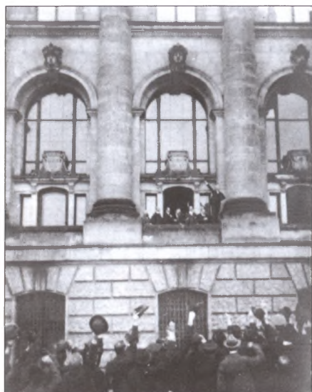
Лидер немецких социал- демократов Филипп Шей- демманн провозглашает Германию республикой. Берлин, Рейхстаг, 9 ноября 1918 г.