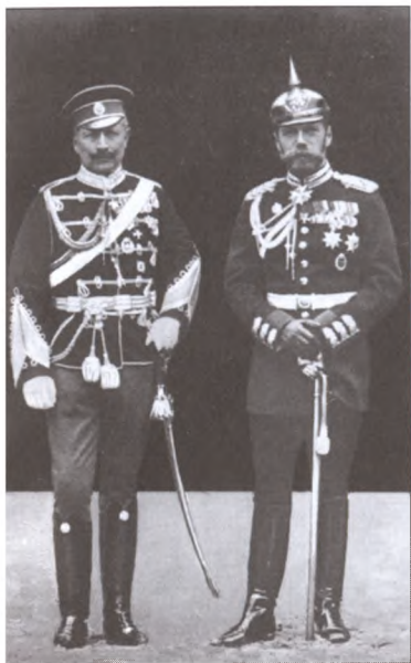
Августейший маскарад с переодеванием: два венценосных родственников обменялись униформами. Германский кайзер Вильгельм II и российский самодержец Николай II. Бьерке (Финляндия), 1905 г.

П.Н. Дурново. За полгода до начала Первой мировой войны изложил Николаю II точный прогноз её хода и последствий для России. За это некоторые считают его чуть ли не провидцем, тогда как он всего лишь высказал то, что было ясно любому достаточно умному политику