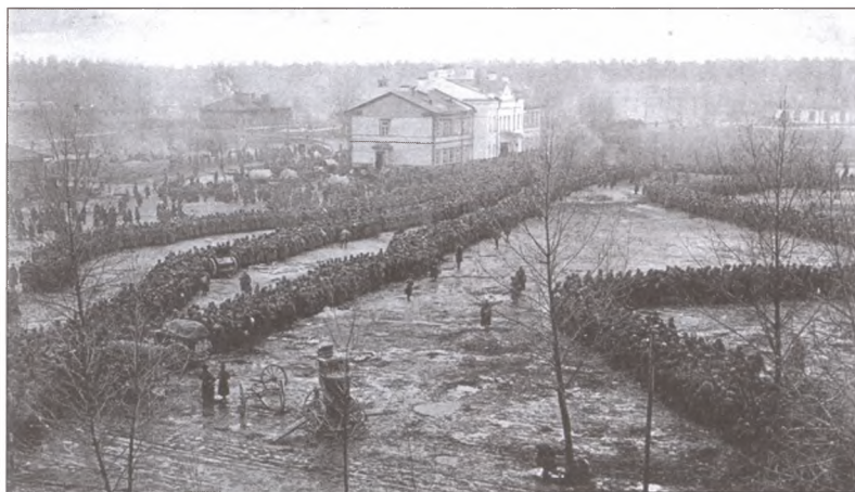
Русские пленные, взятые немцами в сражении под Августовом. Февраль 1915 г.