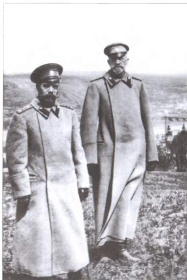
Николай II и великий князь Николай Николаевич под Перемышлем. Апрель 1915 г.