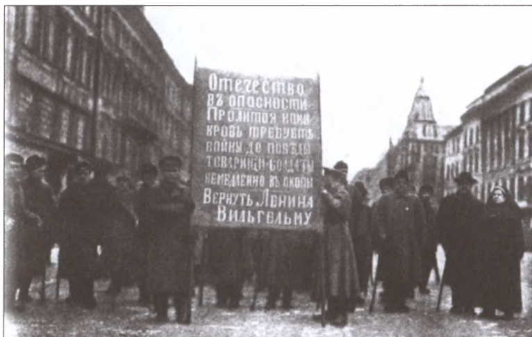
Уже весной 1917 года нашлось немало поверивших в анекдот, будто Ленин был заслан в Россию германским Генштабом