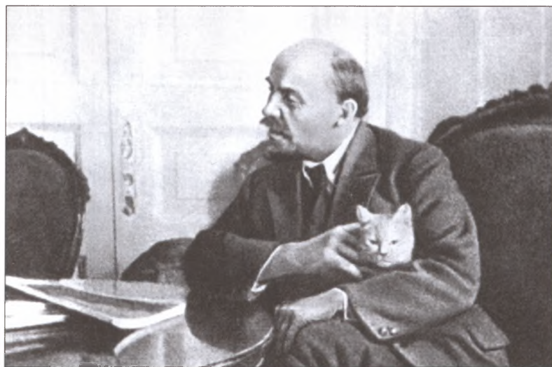
Лидер партии большевиков, председатель Совета Народных Комиссаров Российской Советской Республики Владимир Ильич Ульянов (Ленин) в период Гражданской войны