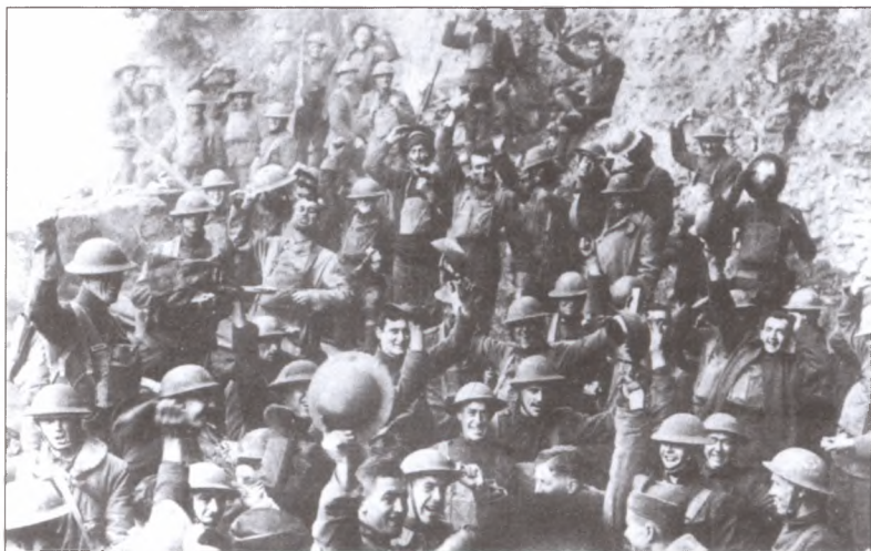
Победа! Союзники ликуют. Празднование перемирия в 64-м американском полку. Ноябрь 1918 г.