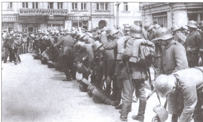
Вступление германских войск в Киев. 1 марта 1918 г.