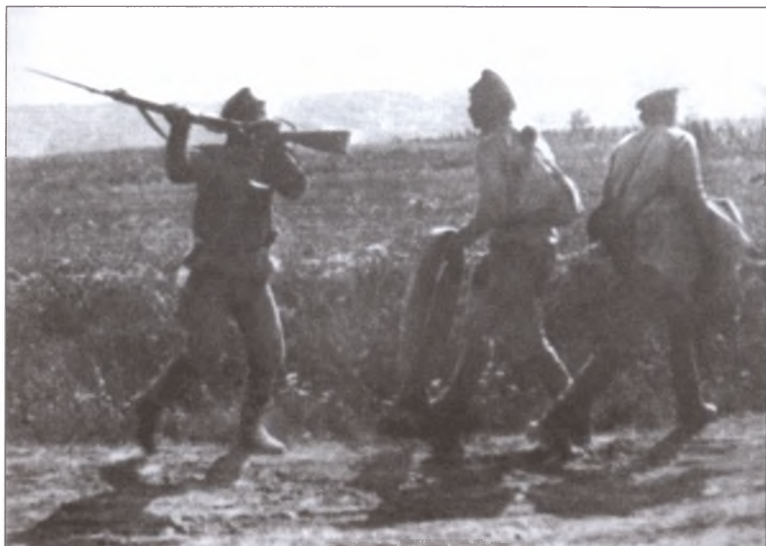
Февральская революция расколола Русскую армию. Конфликт солдата, остающегося на фронте, со своими дезертирующими товарищами