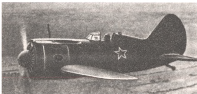
Истребители И-15 (сверху) и И-16 (снизу). Мединский не видит разницы между ними.

Отсюда и выражение «сжечь за собой мосты». Но вот сжечь пути к отступлению, будь то германский автобан или козья тропинка в Альпах, Миахе было не под силу, обладай он хоть талантами Наполеона и Цезаря вместе взятых.