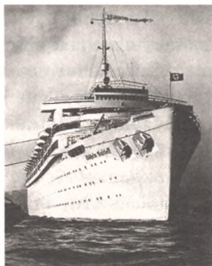
Немецкий лайнер «Вильгельм Густлов», потопленный лодкой С-13. Легким движением клавиши Мединский превратил 406 погибших на нем подводников в 1300.

ся любимыми приписками. В реальности на «Густлове», помимо прочих, плыли 902 курсанта и 16 офицеров (включая 8 военных врачей) 2-го батальона 2-й учебной дивизии подводных сил, из которых погибло только 406 человек. Маловато будет? И легким тычком в клавиатуру четыре сотни покойников превращаются в «1300 немецких подводников, среди