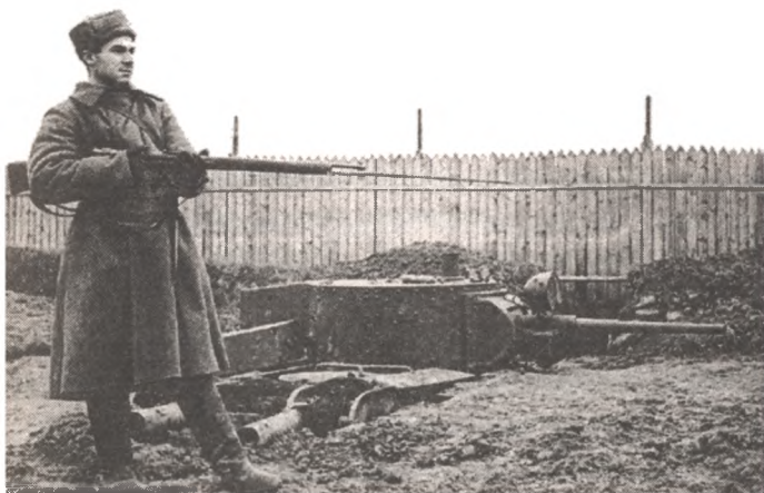
Неисправный танк БТ-7, превращенный в неподвижную огневую точку и врытый в пригороде Москвы. Рядом стоит солдат (предположительно — ополченец) с французской винтовкой Лебеля

альные подвиги, подтвержденные документально, причем не только с советской, но и с немецкой стороны. Мединский, однако, ими интересоваться не стал.