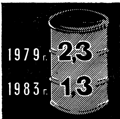
Рис. 1. Падение добычи нефти в Нигерии (млн. баррелей в день)

Следовательно, к причинам инфляции в Нигерии можно отнести значительный рост финансовых ресурсов, которыми располагает правительство, что отражают масштабы государственного бюджета, капиталоемкий характер нефтяной промышленности и расходы нефтяных компаний на приобретение местных товаров и услуг. Однако критический анализ нынешнего состояния нигерийской экономики позволяет вскрыть и другие причины инфляции, маскируемые нефтяным бумом: