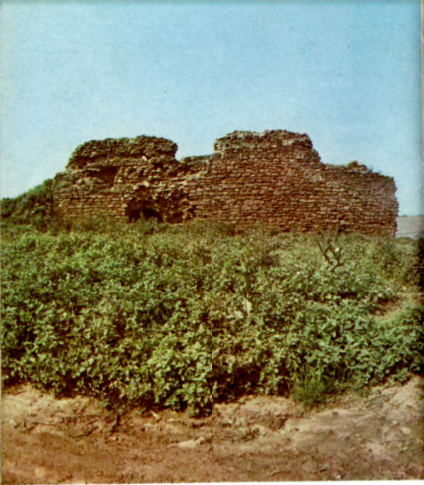
Седые камни Аккермана The ancient stones of Akkerman