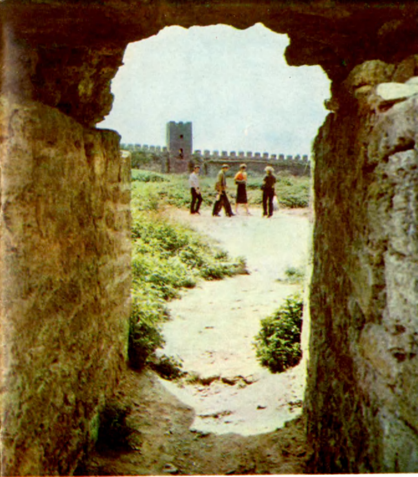
Сквозь крепостную амбразуру Looking through the gun port of the fortress