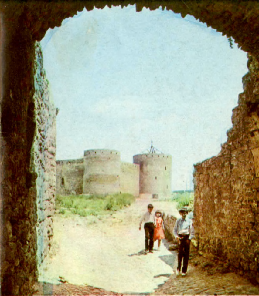
Самая древняя часть крепости — Цитадель Citadel is the most ancient part of the fortress