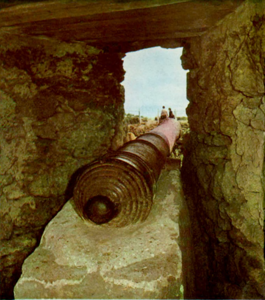
Старинная пушка An ancient cannon