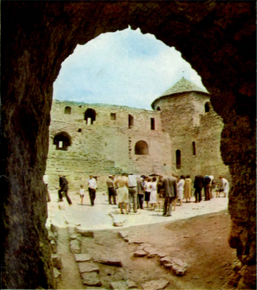
Цитадель. Внутренний двор Citadel, the Inner court yard