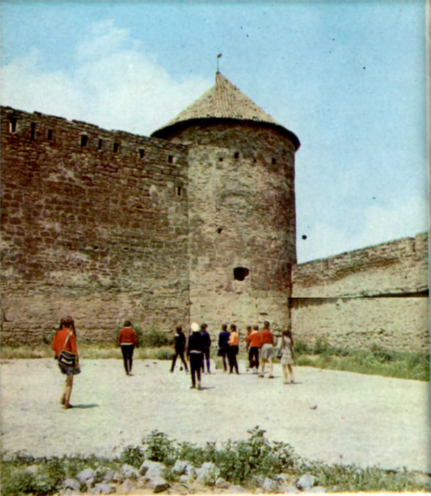
Вид крепости со стороны Гражданского юра The view of the fortress from the Civil ct yard side