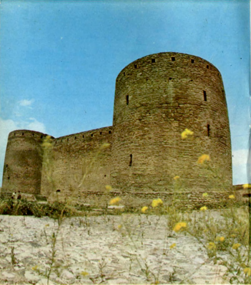
Могучие бастионы Цитадели Powerful bastions of the Citadel