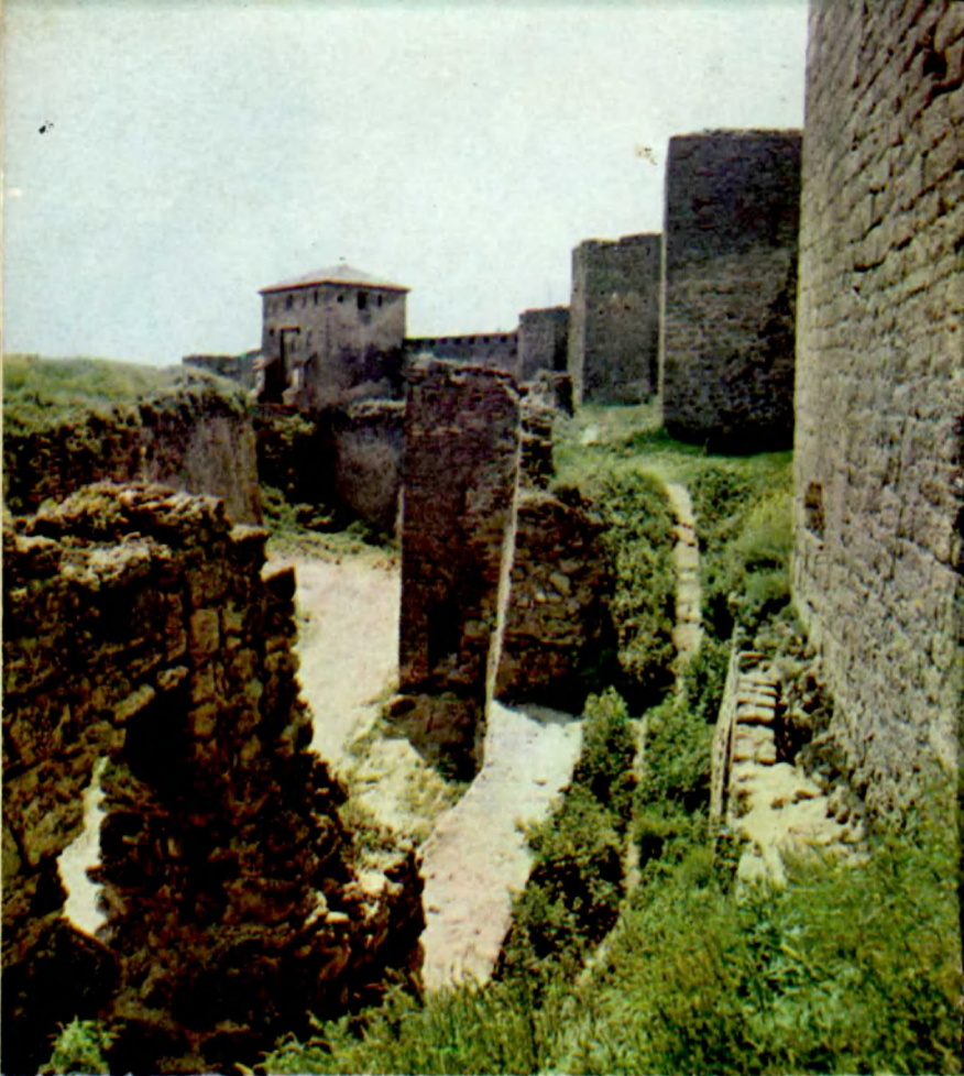
Двухкилометровым кольцом опоясывает крепость обводной ров The fortress is encircled by a two-kilometre by-pass moat