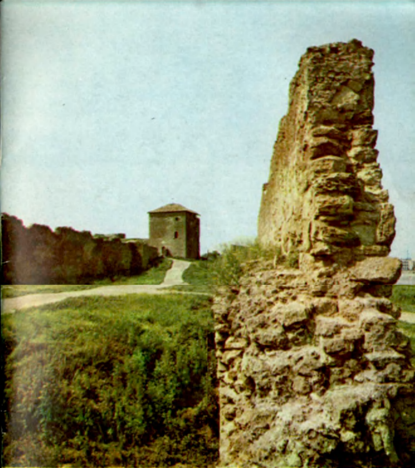
Руины Пристанского двора Ruins of the Pristan'sky (Dock) courtyard