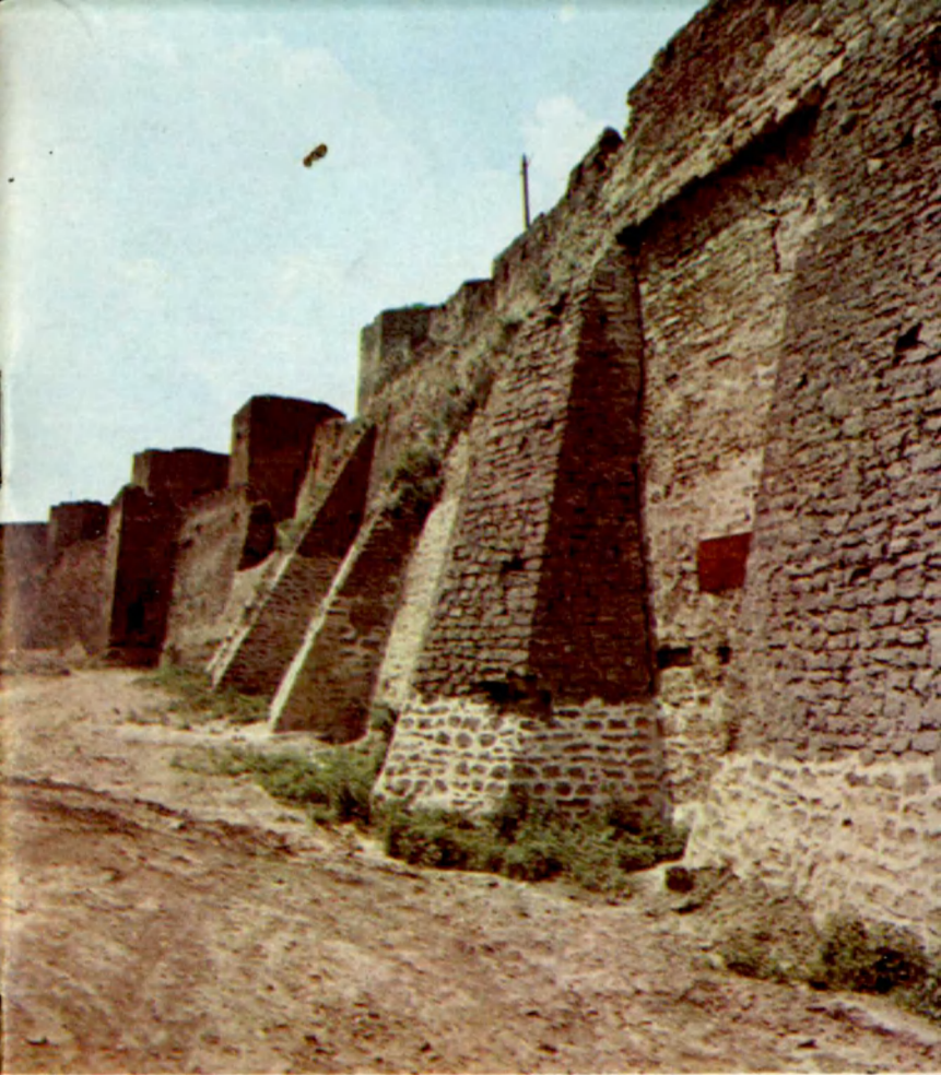
Могучие контрфорсы поддерживают крепостные стены Huge counterforts support the walls of the fortress