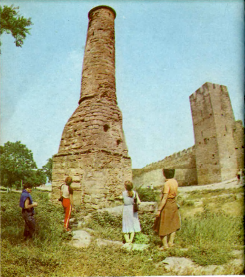
Центральная часть Гражданского двора Central part of the Civil court yard