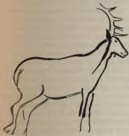
Рис. 5 (1/14).