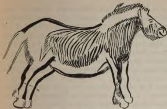
Рис. 3 (1/24).