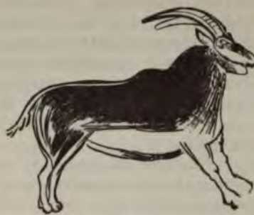
Рис. 4 (1/10).