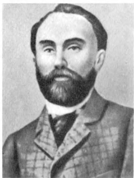
Г. В. Плеханов В. И. Засулич В. Н. Игнатов Л. Г. Дейч П. Б. Аксельрод