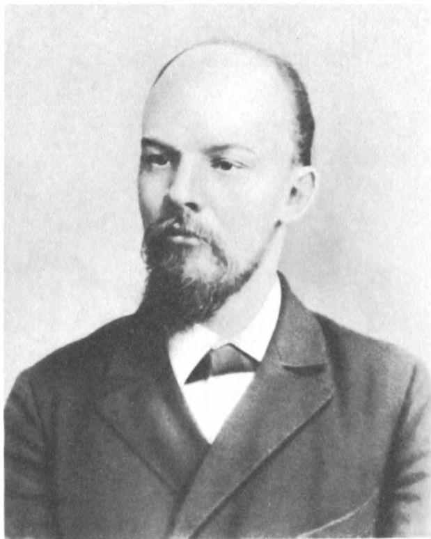
В. И. Ленин. 1897 г.