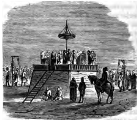
Примѣчаніе. Рисунокъ этотъ сдѣланъ Вологдымъ карандашомъ и сильнѣю постерся. М. С.