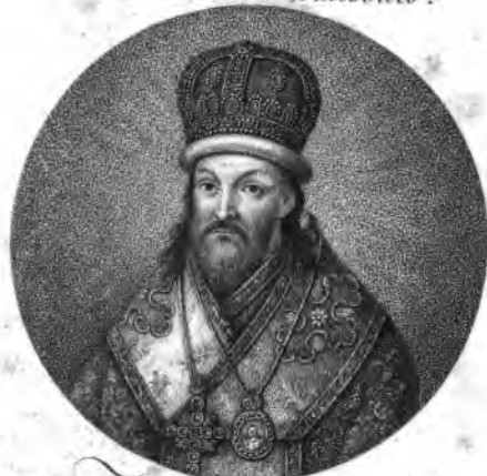
Святый Димитрій Митр. Рост.