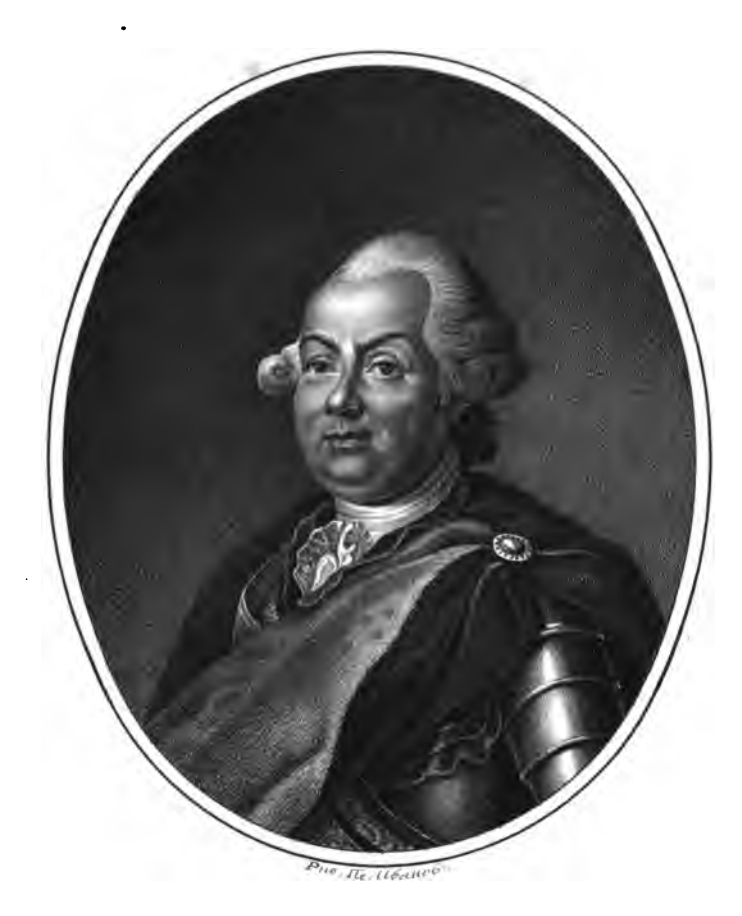
Trages Tempo Liencarid pobiero