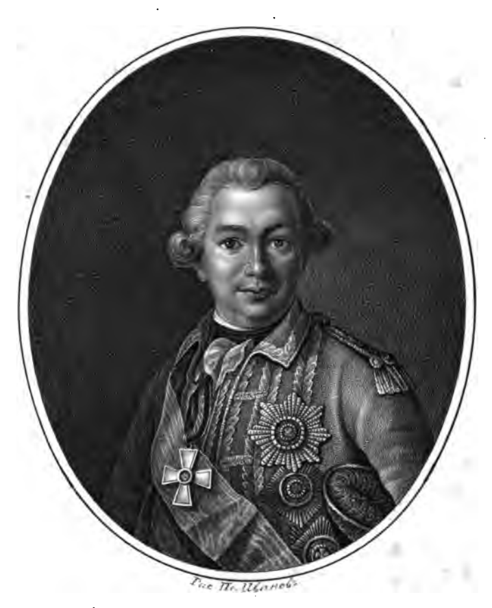
Tpacks Ubano Tempoburt