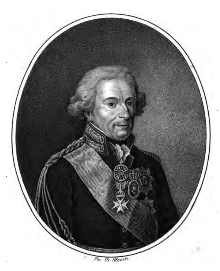
Tingzo Nukaraŭ Ubanoburo