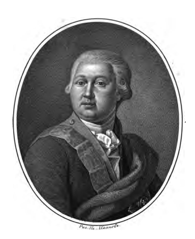
Tpaces Basenmens Karronoburi