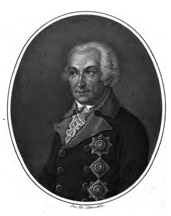
Knazo Nukaran Bacurbeburb