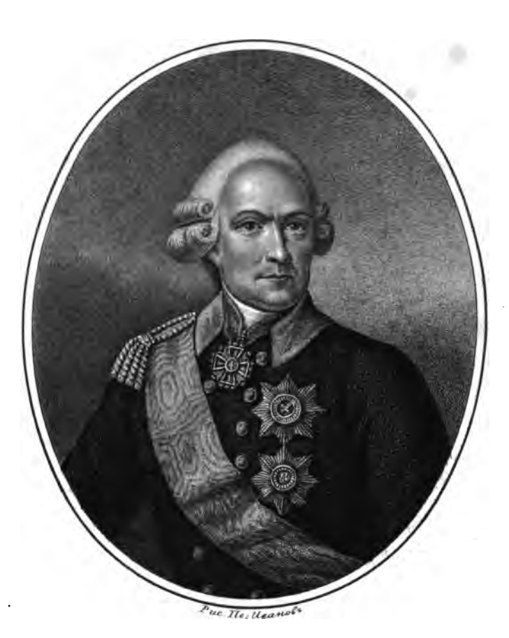
Tpacpe Ubane Kapnoburt