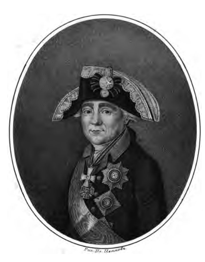
Tragos Muxauer Oedomoburo