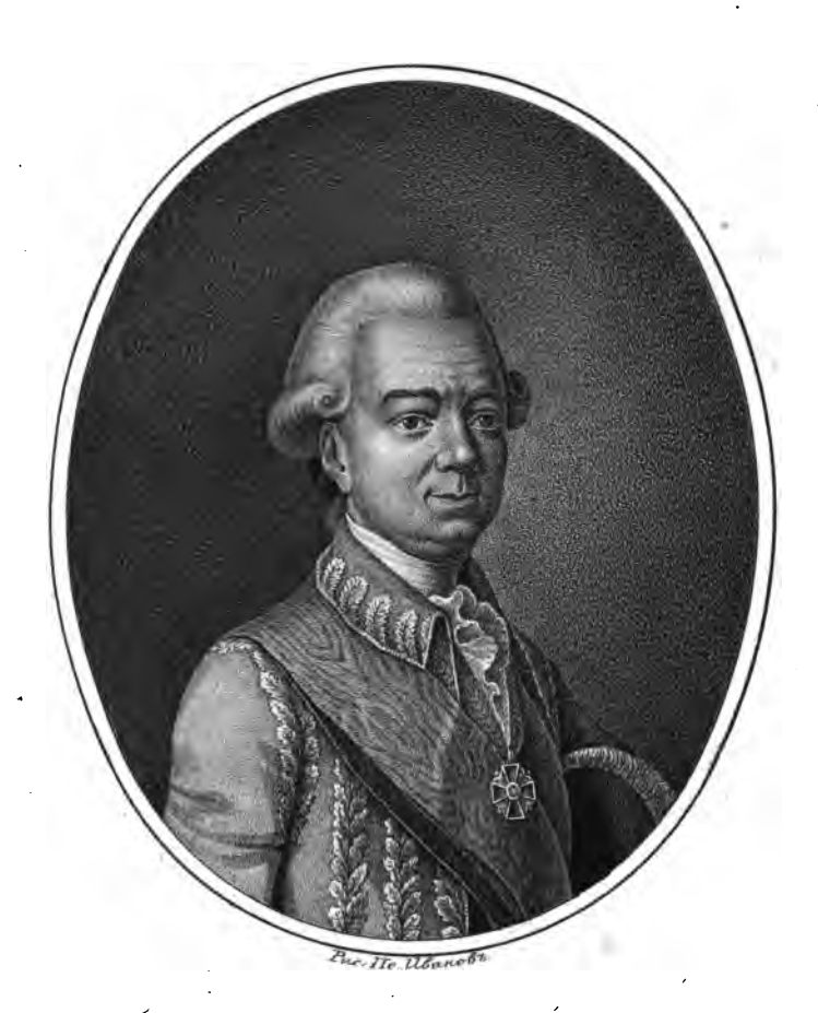
Графъ Захаръ Григорывичь