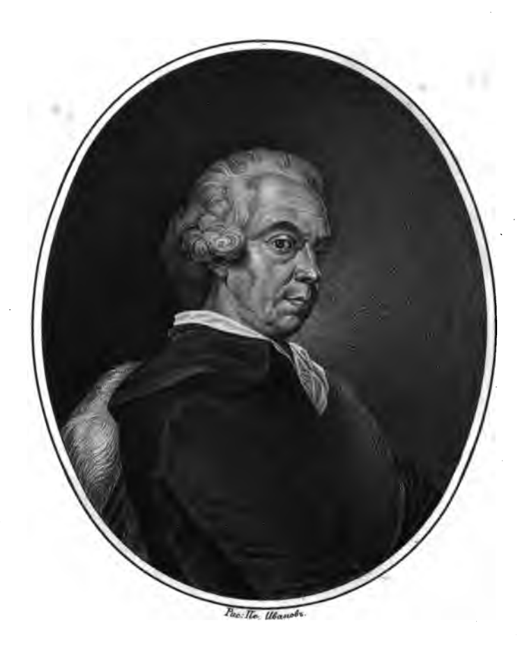
Trapo Ubario Truropoeburb