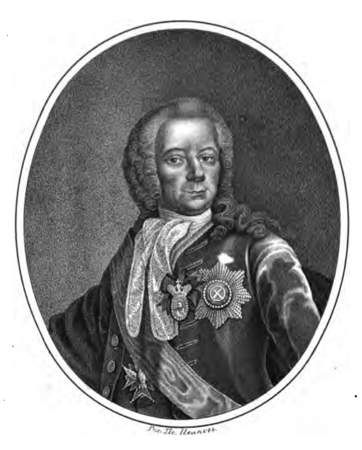
Tracpo Acexoroù Tempoburo