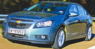
38 НЕ ПРОСТО БАНТИК «Шевроле-Круз»