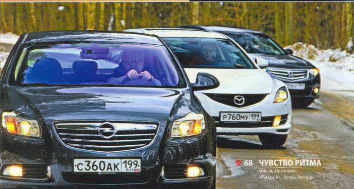
68 ЧУВСТВО РИТМА «Опель-Инсигния», «Мазда-6», «Хонда-Аккорд»