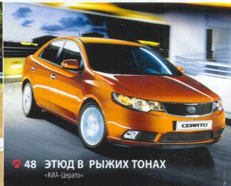
48 ЭТЮД В РЫЖИХ ТОНАХ «КИА-Церато»