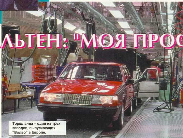
Торшланда – один из трех заводов, выпускающих "Волво" в Европе.

Действительно, из 361,5 тысячи легковых автомобилей, проданных в 1994 году, почти три четверти приходится (в сумме) на семейства -850, -940 и -960. На мой взгляд, это прежде всего говорит об умении определить свой круг покупателей, реагировать на изменение их запросов, а для этого – систематически изучать клиентуру.