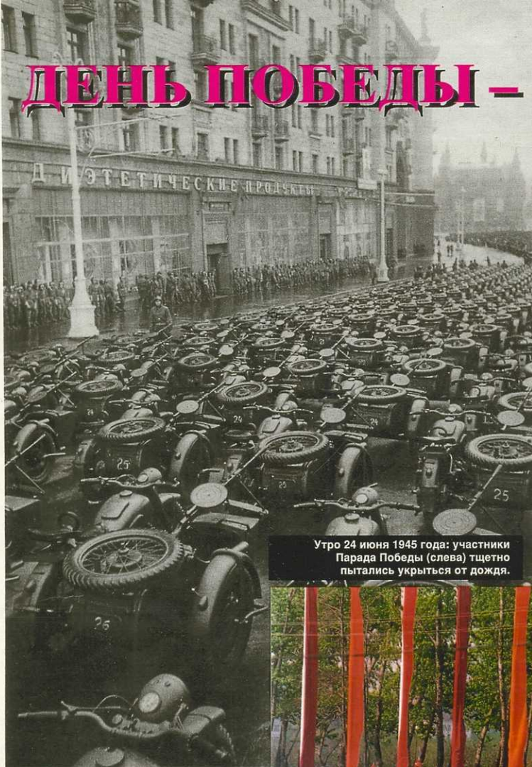
Утро 24 июня 1945 года: участники Парада Победы (слева) тщетно пытались укрыться от дождя.

кестр на Красной площади играл "Суворовский марш". Из валторн выливали воду, словно из ведер, а солдаты незаметно подменяли намочшие барабаны сухими. Ордена Победы на мундирах Жукова и Рокоссовского не горели солнечными зайчиками, а подошвы и гусеницы скользили по брусчатке, угрожая нарушить равнение. Но все-таки в каждом движении, в каждом действии, даже в каждом помысле жила искра оптимизма. Мы все были вскормлены войной, воспитаны войной, сформированы войной – то были самые яркие годы нашей жизни, взрослых и детей, фронтовиков и тыловиков. "Мы за цену не постоим" – это владело тогда умом каждого.