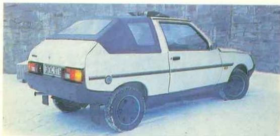
«Таврия» с кузовом «кабриолет» наверняка понравится покупателям в субтропиках.