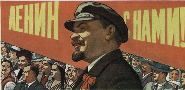
Плакат художника В. Иванова, выпущенный Издательством к 60-летию II съезда КПСС.