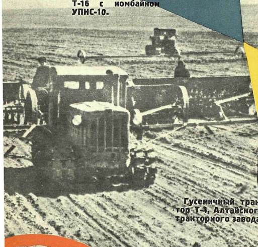
Гусеничный трактор Т-4, Алтайского тракторного завода.

(Из постановления январского Пленума ЦК КПСС)