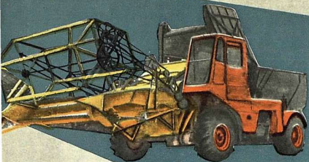
Самоходное шасси Т-16 с комбайном УПС-10.

«Пленум ЦК КПСС считает важнейшей и неотложной задачей осуществление крупных мер по значительному развитию сельскохозяйственного машиностроения, производству мощных тракторов с повышенными скоростями и орудий к ним, самоходных шасси, зерновых, кукурузных и силосных комбайнов, машин для послепосевочной обработки зерна, хлопкоуборочных машин, оборудования и машин для механизации работ в животноводстве, внесения органических удобрений, автомашин и транспортных тележек, техники для ирригации и мелиоративных работ, проведения сельскохозяйственных работ в горных условиях».