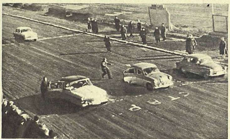
Старт третьего зимнего автомобильного ралли в Риге. Отчет см. на стр. 16.