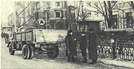
Десяти тысяч энтузиастов участвуют в борьбе с нарушителями правил уличного движения. И а с н и м к е: патруль народных дружин на улице г. Хабаровска. Статью о работе дружин см. на стр. 4-5.

На первой странице о бло ж ки рисунок Ю. Батова.