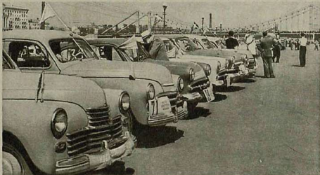
17 мая в Центральном парке культуры и отдыха им. М. Горького состоялся финиш многодневного спортивно-туристского пробега по маршруту Москва — Севастополь — Москва (см. стр. 9—11).