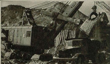
На строительстве Михайловского железорудного комбината. Вскрышные работы в карьере (см. стр. 4).

На четвертой странице обложки: Ночь на шоссе.