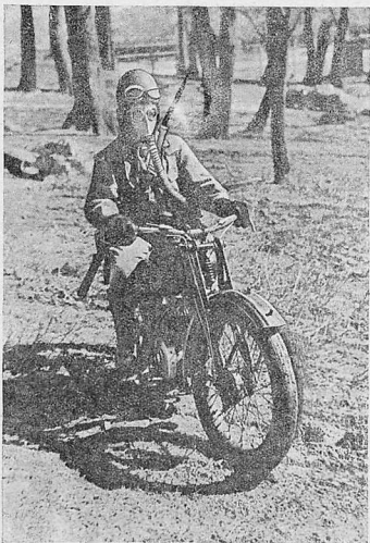
Со срочным донесением через «зараженную» зону

Физическая тренировка осоавиахимовца-водителя совершенствуется качеством бойца. Сдача норм на значок «Готов к труду и обороне» должна стать обязательной для каждого осоавиахимовца.