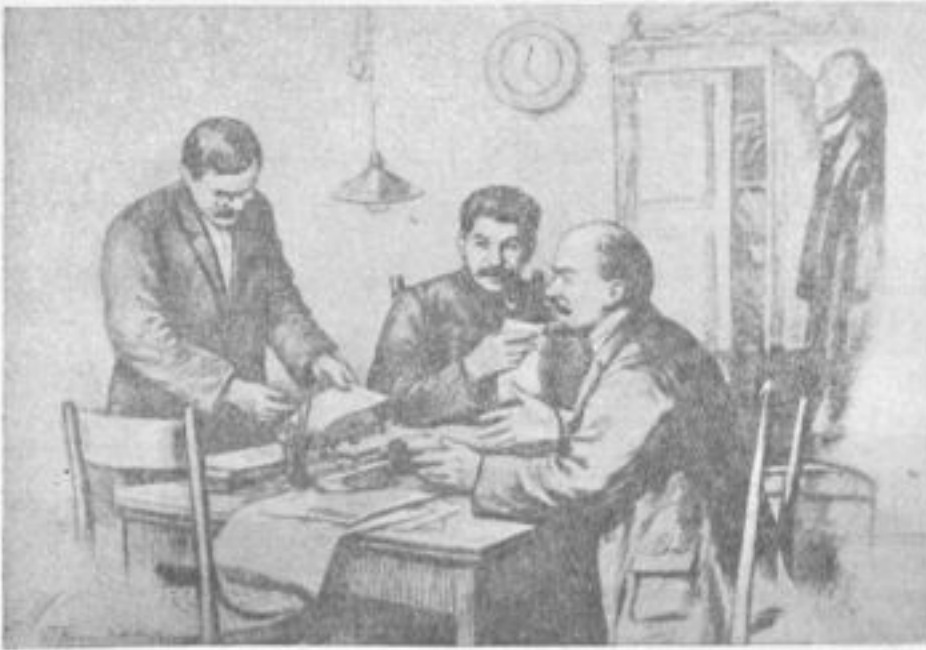
В. И. Ленин, И. В. Сталин и В. М. Молотов в редакции газеты «Правда» в 1917 году

следит товарищ Молотов за ростом людей, чутко прислушивается к голосу каждого трудящегося. Разве не примечателен следующий факт: на III сессии ЦИК СССР (в январе 1932 г.) товарищ Молотов вместо заключительного слова о задачах в связи с новым годовым планом целиком цитирует речь беспартийной работницы Нарофоминской текстильной фабрики. Таким образом, Вячеслав Михайлович придал высказыванию рядовой текстильщицы характер большого государственного значения — директивы Совета Народных Комиссаров СССР.