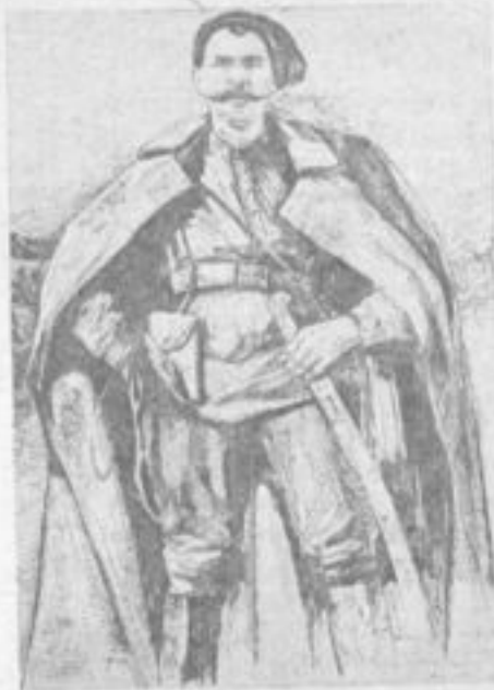
В. И. Чапаев

Сергей Лазо назначен командующим войсками забайкальского фронта. Под его руководством подавляются многочислен-