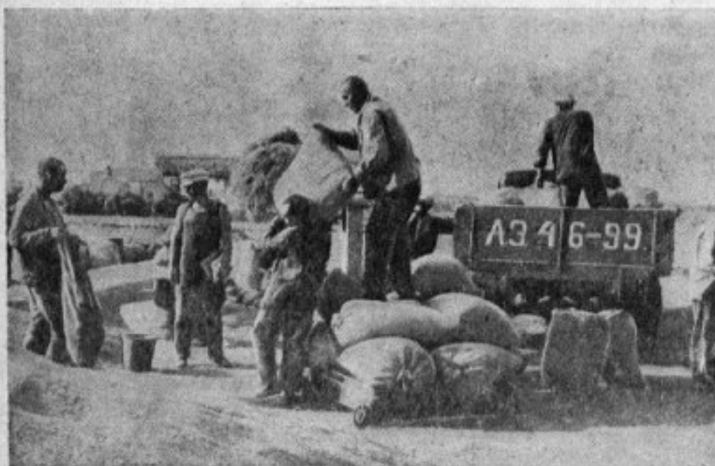
Уборка зерновых в колхозе «Первая пятилетка» (Батайский район, Ростовской области). На снимке: отправка зерна с тока бригады № 6 на элеватор

«В ответ на наглую вылазку японской военщины, — говорится в резолюции 20-тысячного митинга трудящихся в Самарканде, — мы обещаем удесятить нашу работу по укреплению обороноспособности страны, превратить каждую осоавиахимовскую ячейку в боевое подразделение».