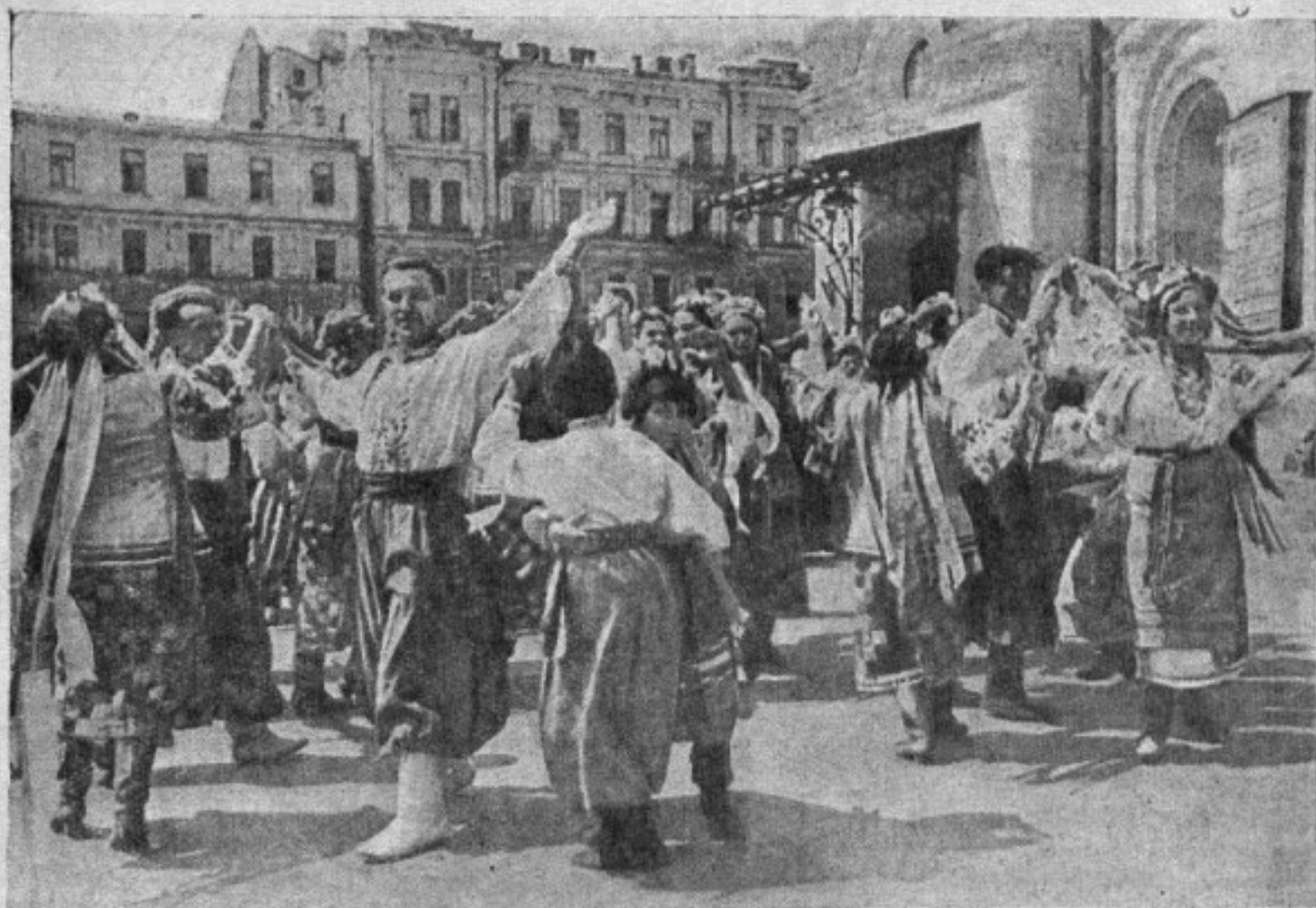
В день выборов Верховного Совета Украинской ССР. На снимке — выступление кружка самодеятельности клуба железнодорожников им. Фрунзе в Киеве