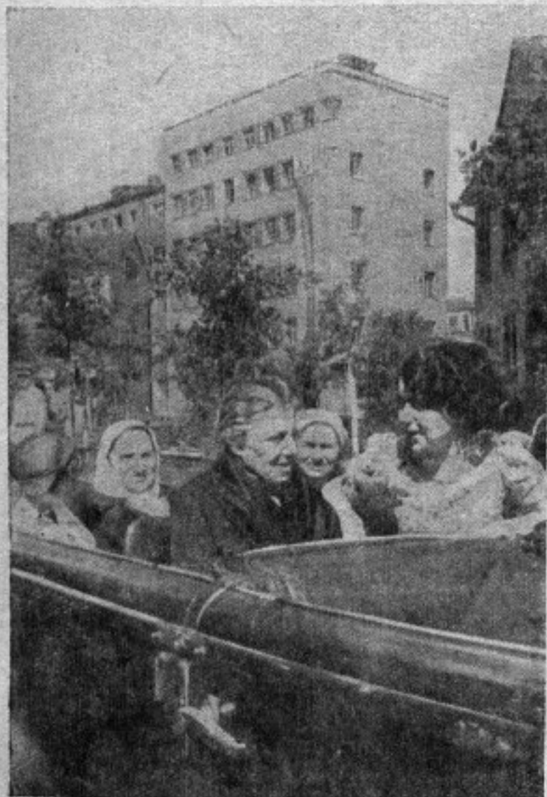
Пожилые избирательницы Сталинского избирательного округа Москвы возвращаются домой после голосования