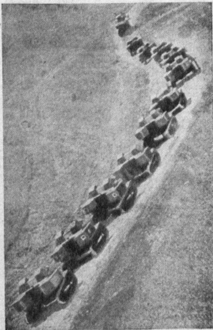
На маневрах частей Киевского военного округа. Танки в походе

Значительная часть водителей умеет только водить машину («рулить»), поверхностно зная ее устройство. Поэтому необходимо пересмотреть программы наших автошкол, оборудовать эти школы хорошими классами по изучению материальной части, по парковой (гаражной) службе, по вопросам эксплуатации и ремонта. Что же касается обучения вождению, то здесь