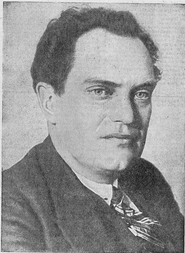
Валериан Владимирович КУЙБИШЕВ

РЕДАКЦИЯ: Москва, 1-й Са- мотечный пер., 17. Телеф. Д 1-23-83. Трамваи: 28, 11, 14