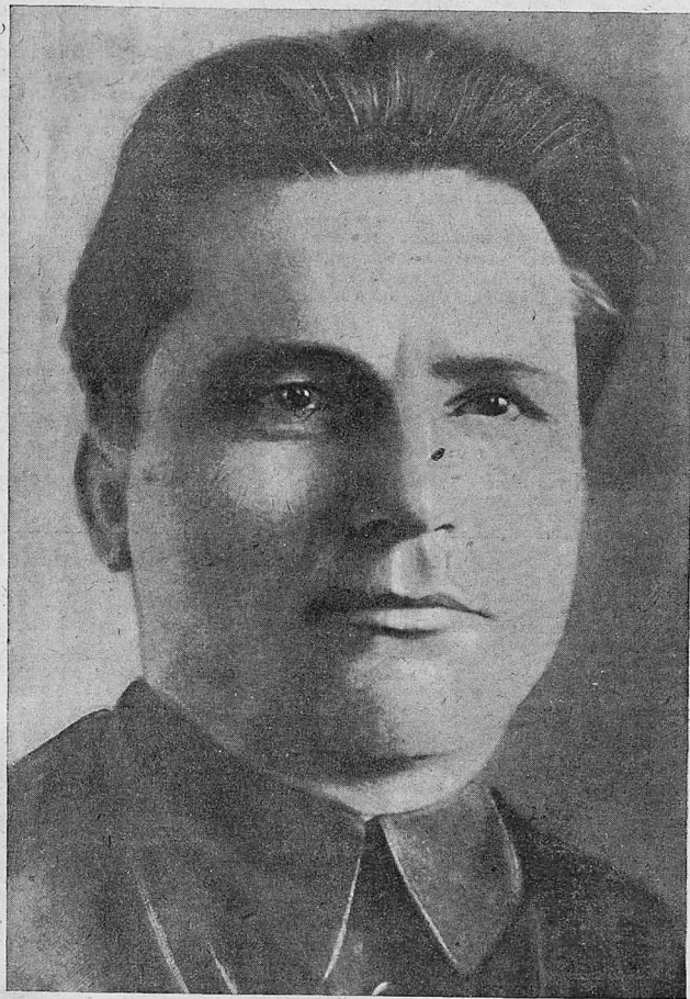
Сергей Миронович КИРОВ

Автомобиль — трудящимся! ЖУРНАЛ ВСЕСОЮЗНОГО ОБЩЕСТВА АВТОДОР РЕДАКЦИЯ: Москва, 1-й Са- мотечный пер., 17. Телеф. ВЫХОДИТ ДВА РАЗА В МЕСЯЦ Д 1-23-87. Трамвай: 28, 11, 14.