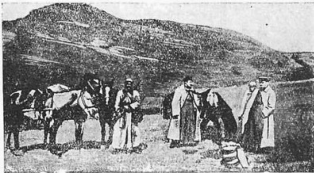
Советские пограничники в горной полосе