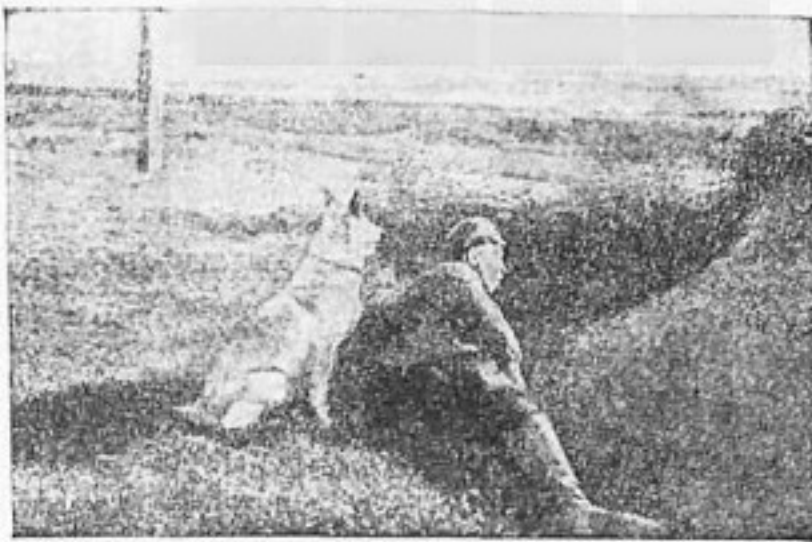
Пограничник в доворе

выполняя волю своих хозяев, стремятся обратиться к нам для вредительской работы и убийств. Они идут не только одиночками, но и целыми группами, хорошо вооруженные. При поимке их пограничной охраной они, зная, что их ожидает, обычно оказывают отчаянное сопротивление. Борьба с ними отнимает у наших пограничников не мало жертв.