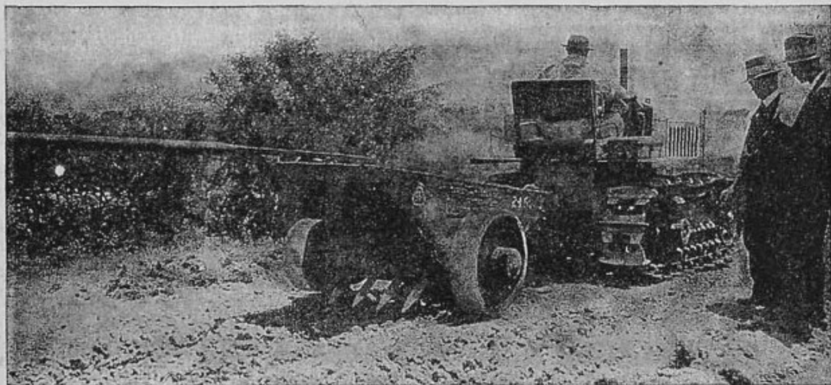
«Клетрак» модели «30» в работе с грейдером (уравнителем почвы).

Тракторы для постройки дорог и ухода за ними.