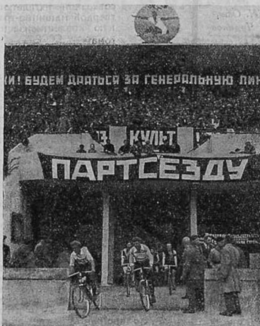
3 июля на стадионе „Динамо“ состоялся финиш Всесоюзной звездной авто-мото-вело эстафеты, организованной ВСФК вместе с ЦС Автодора. Участники эстафеты привезли XVI партс'езду многочисленные рапорты от физкультурных организаций, фабрик и заводов.

На одном из последних заседаний президиума обсуждался вопрос об организации специального „дня дороги“. Президиум отклонил предложение об организации этого „дня“ в Москве и решил организовать в ближайшее время специальный „день дороги“ в провинции в одном из крупных районов или нацреспуб-