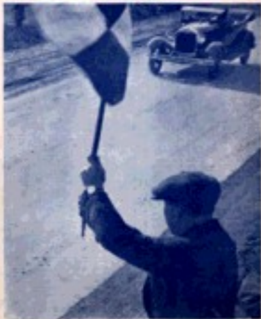
ДОРОГУ СОВЕТСКОМУ АВТОМОБИЛЮ: на автомобильные знаки: знаки дорожные и дорожные знаки Советского Союза