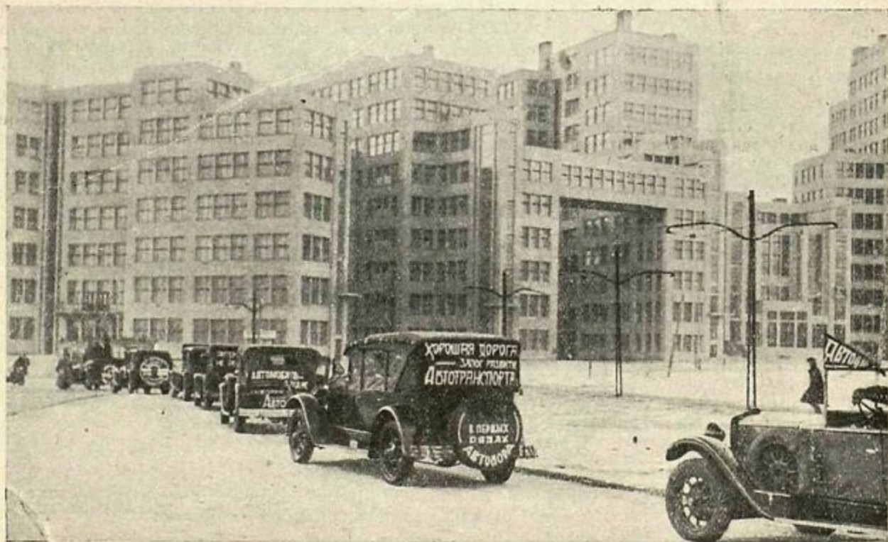
Агитационный автокарнавал в Харькове во время с'езда Укравтодора

Первый год работы Автодора был годом автомобильной и дорожной революции в умах трудящихся и в этой работе журнал был серьезным и полезным орудием агитации.