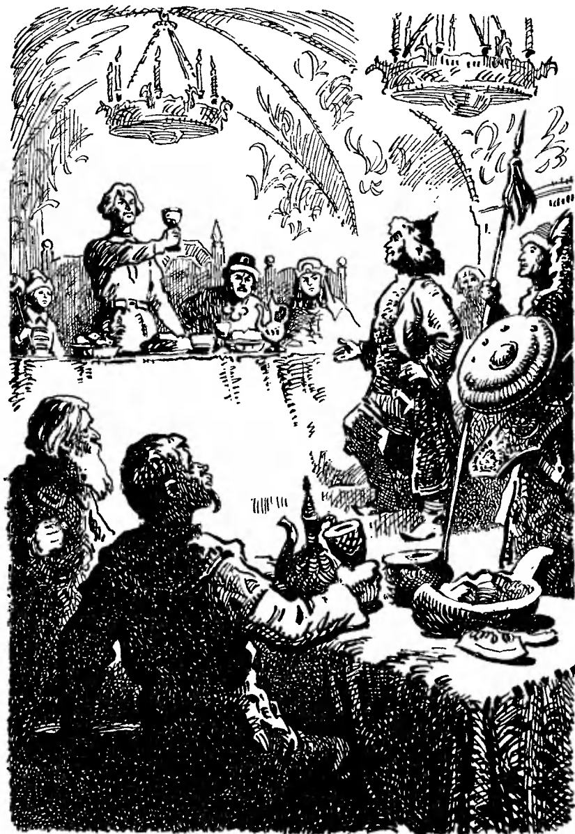
Александр протянул кубок ордынскому царевичу.

Благозвучным голосом, заполнившим всю палату, он на татарском языке обратился к Чагану.