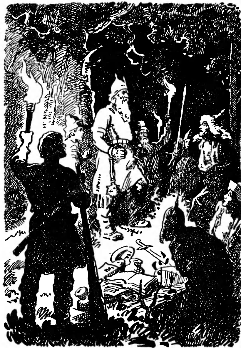
Гасило угрюмо слушал угрозы царевича.