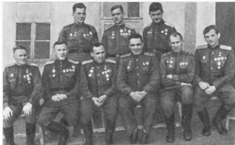
Руководящий состав 1-й гвардейской истребительной авиадивизии