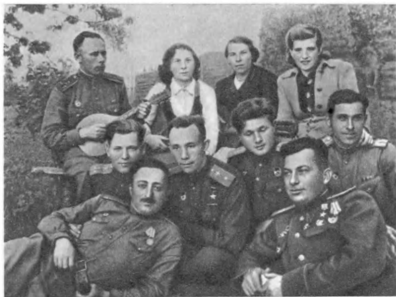
В часы досуга