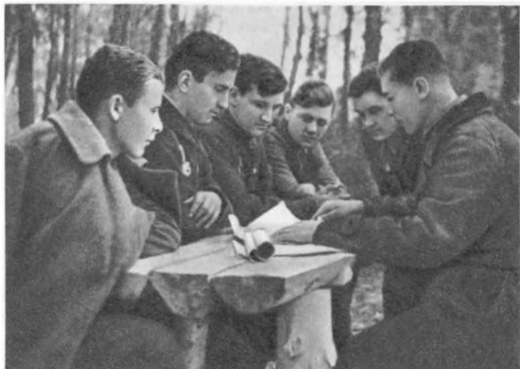
Изучение боевого задания