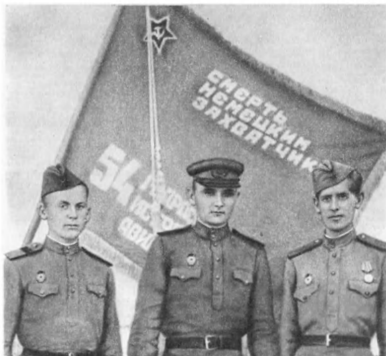
У гвардейского Знамени