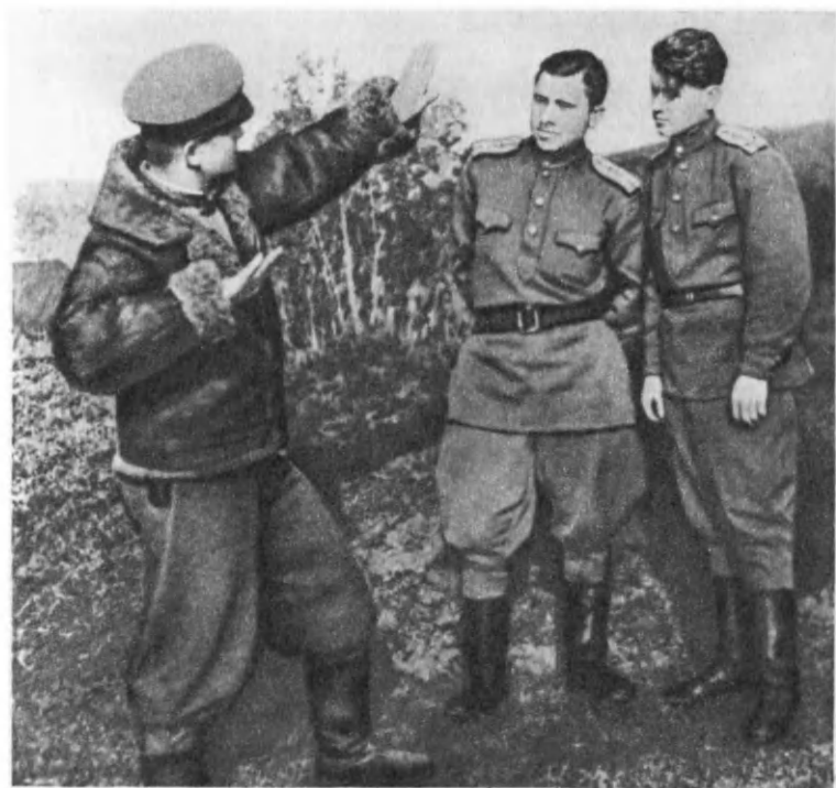
Разбор воздушного боя