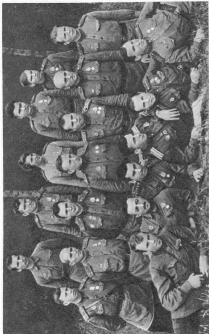
Управление 54-го гвардейского истребительного авиаполка