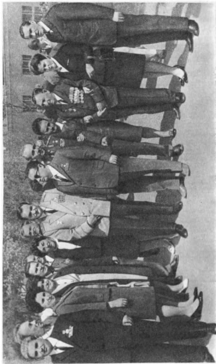
9 мая 1970 г. Встреча ветеранов