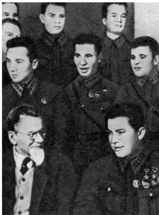
М. И. Калинин среди участни- ков боев у озе- ра Хасан