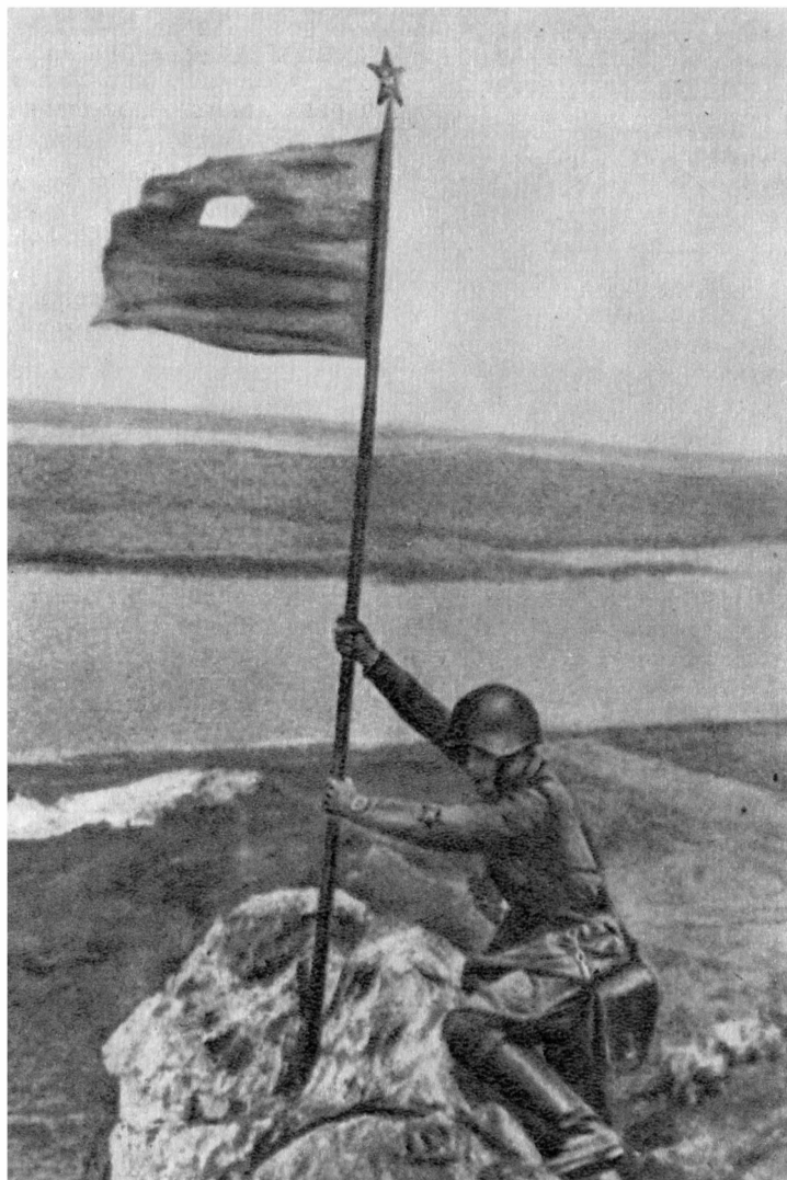
На сопке Заозерной у озера Хасан, 1938 год