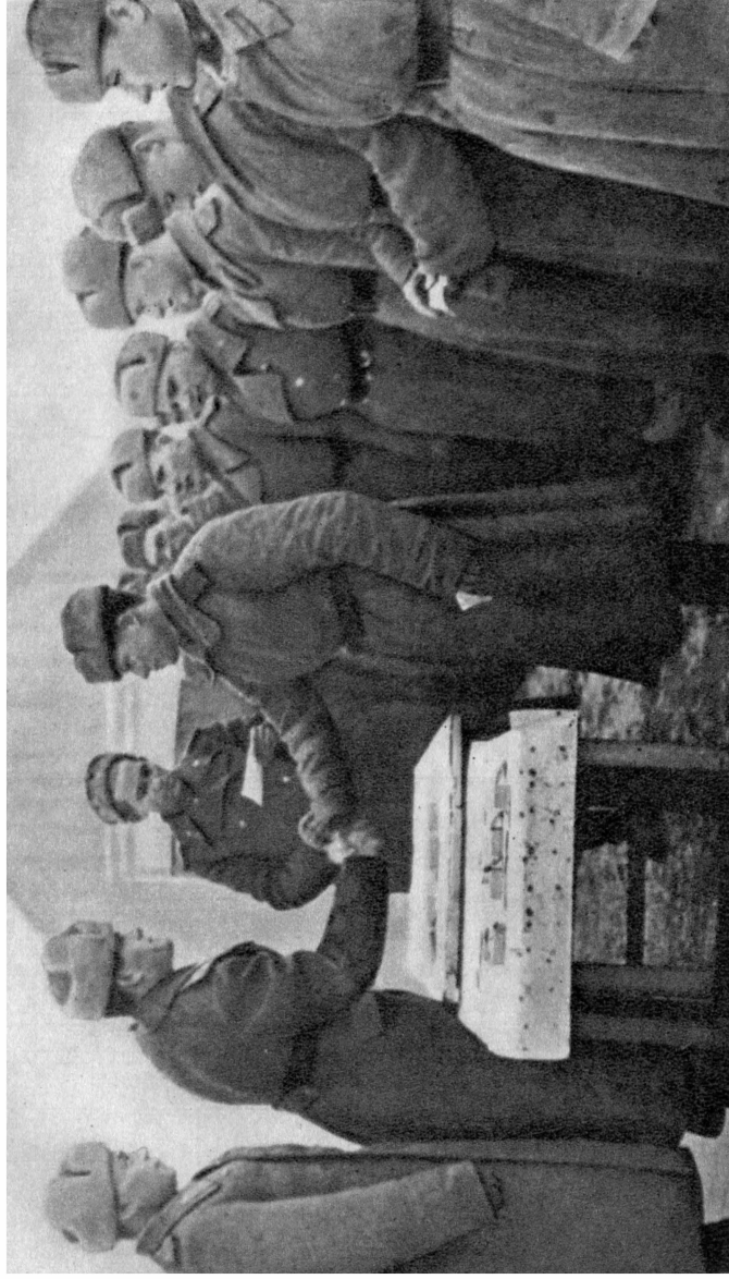
Вручение орденов и медалей личному составу дивизии