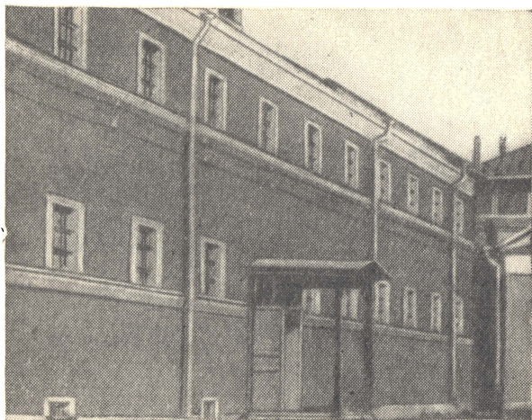
Третий корпус (народовольческий) Шлиссельбургской крепости.

кой косе у крепостной стены. Ведь заключение в эту твердыню самодержавия для большинства узников было просто замаскированной смертной казнью. А Морозов, несмотря ни на что, работал, работал, работал, ибо верил, что его идеи рано или поздно принесут человечеству пользу. Так, в совершенно невероятных условиях царской каторги родился ученый-энциклопедист, ученый-теоретик, внесший огромный вклад в отечественную науку. И когда могучий напор общественного движения 1905 года распахнул ворота Шлиссельбургской крепости, Морозов, покидая остров страдания и смерти, увозил