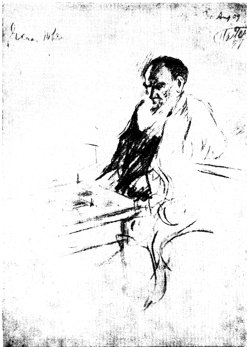
ТОЛСТОЙ ЗА ШАХМАТАМИ Рисунок Л. О. Пастернака