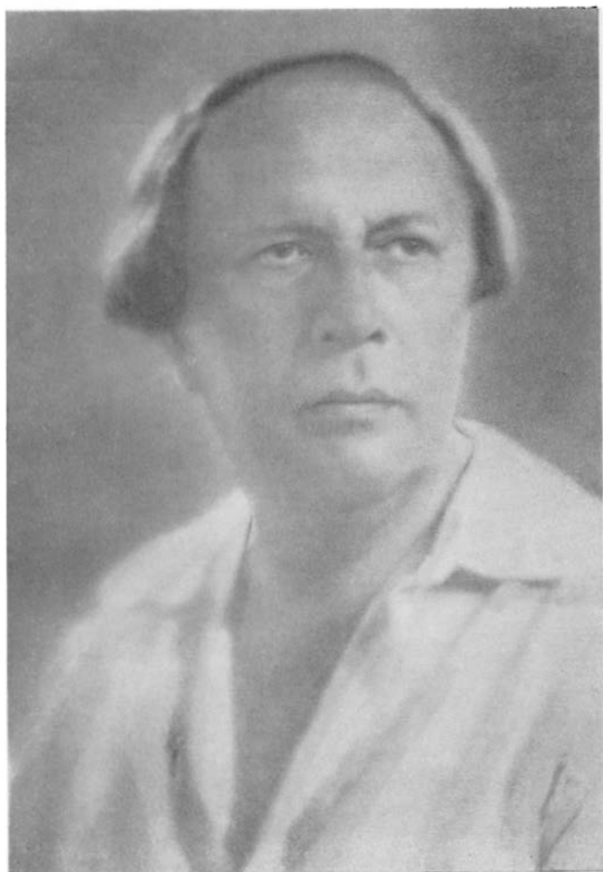
А. Н. ТОЛСТОЙ