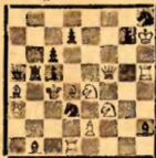
Задача № 1826 М. Сегер (Бельгия) M. Segers