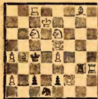
Задача № 1875 А. Пьяттези (Италия) A. Piatetsi