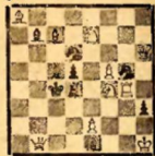
Задача № 1828 Р. Флейсс (Бразилия) J. R. Fleiuss