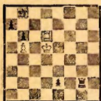
№ 1. Р. Н. Александров. "Шахм. в СССР" № 12, 1934 г.

То же самое можно сказать почти о всех крупнейших мировых композиторах. В чем же здесь дело? Почему композитор, имеющий неограниченное время для обдумывания своего замысла, страдает порой от таких же грубых ляпков, как и шахматист, обьятый предчувствием надвигающегося цейтнота?